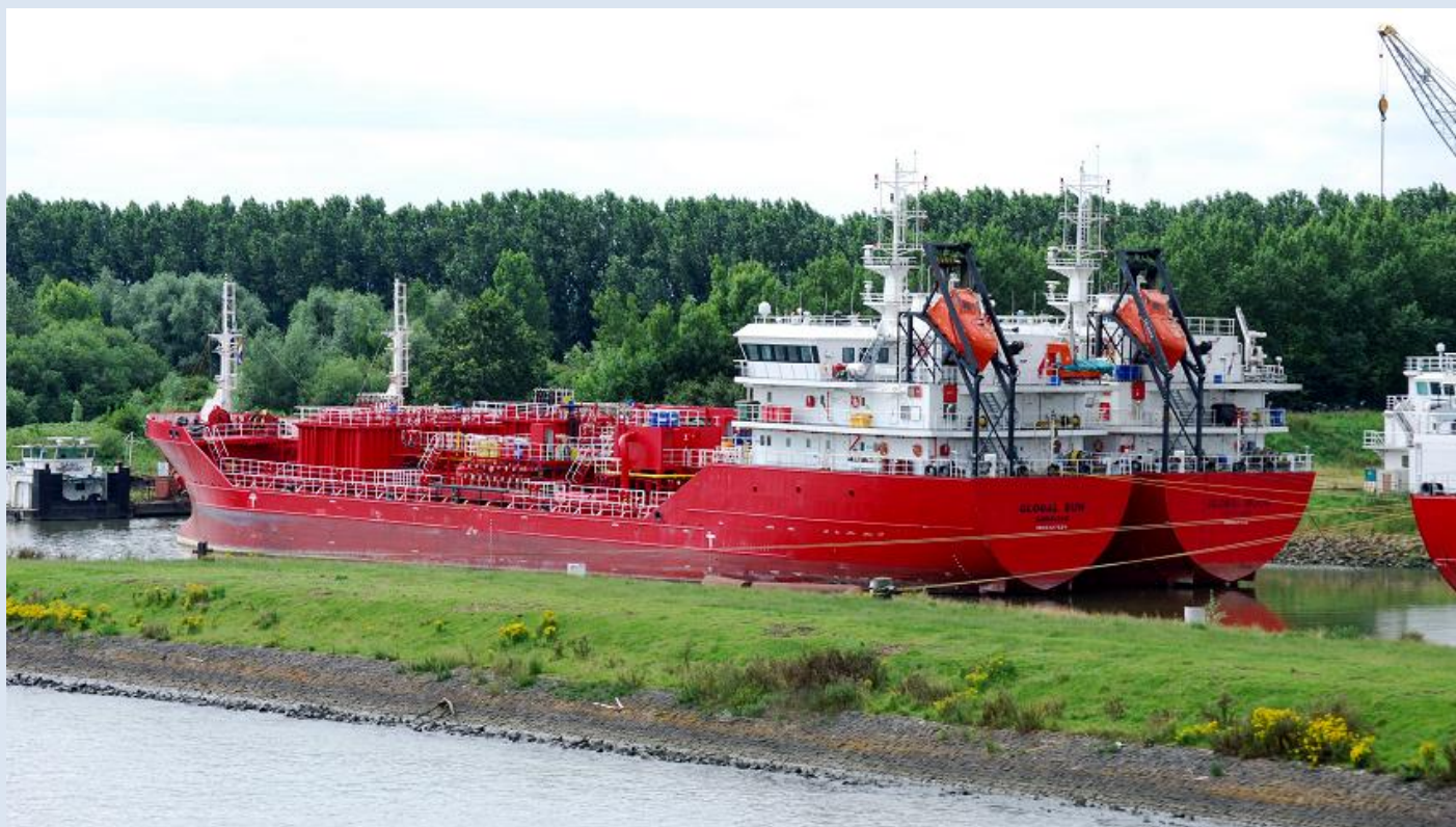
GLOBAL SUN en GLOBAL MOON te 's-Gravendeel, foto: H. Hoffmann.

GLOBAL RIVER 9427445, 10-3-2011 opgeleverd door Jiangsu Ganghua Shipyard Co. Ltd. (GHCY-1002) als GLOBAL RIVER aan Global River Shipping Ltd., Gibraltar, in beheer bij North Sea Tankers B.V., Krimpen a/d IJssel, roepsein 2ZDJY9, 5.424 BRT, 7.500 DWT, 4.674 EPK, 3.340 kW, 2 x MAN B&W 8L 21/31, 14 kn. 21-6-2012 gearriveerd te 's-Gravendeel en opgelegd.