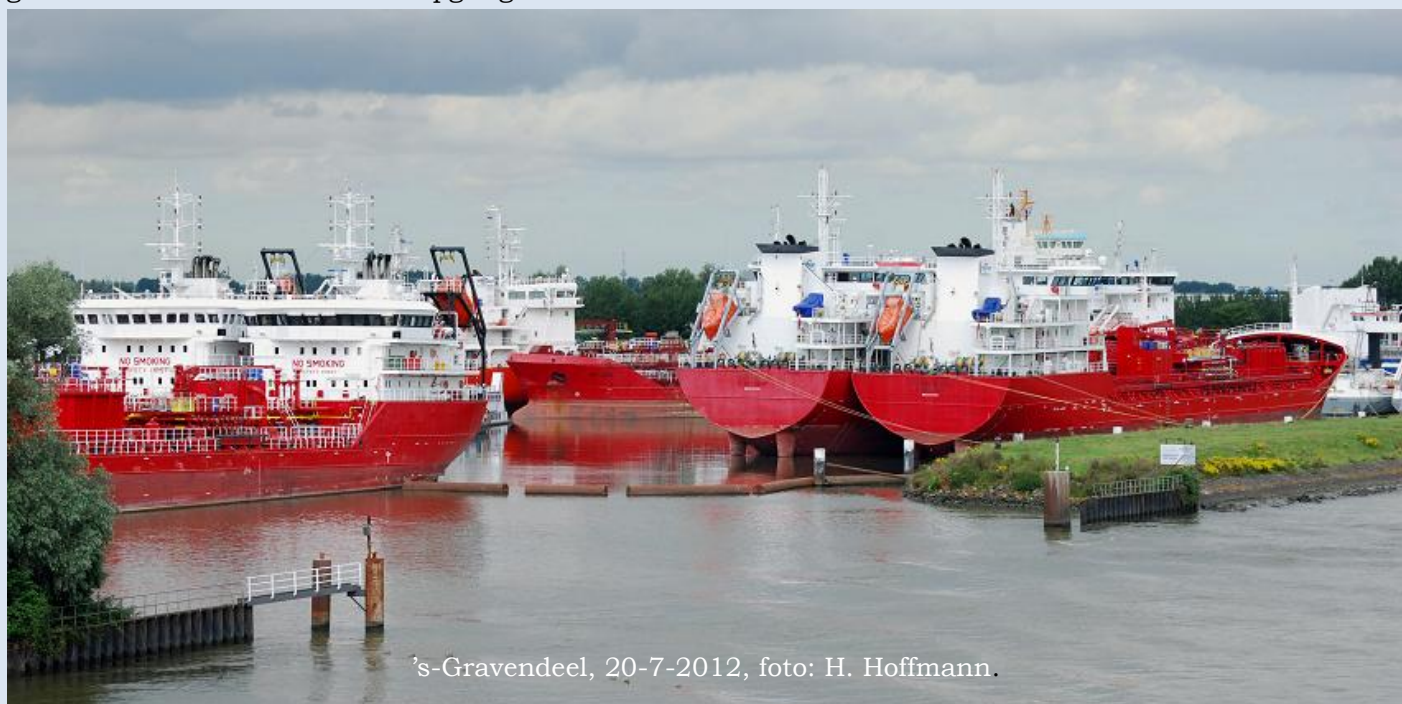
's-Gravendeel, 20-7-2012

GLOBAL MOON 9427512, 6-3-2009 te water gelaten bij Yizheng Yangzi Shipbuilding Co. Ltd., Yizheng onder bouwnummer YZCB2006-3600(II), 8-7-2010 (BV) opgeleverd aan Global Moon Beheer B.V., Gibraltar, in beheer bij North Sea Tankers B.V., Krimpen a/d IJssel (Unifleet B.V.), roepsein ZDJV4, 3.166 BRT, 1.318 NRT, 3.600 DWT, 3.478 EPK, 2.560 kW, MAN B&W 8L23/30, Zhenjiang Marine Diesel Works, 12,5 kn., 11-2010 onder Nederlandse vlag gebracht, roepsein PCIN, thuishaven: Rotterdam. 4-4-2012 gearriveerd te 's-Gravendeel en opgelegd.