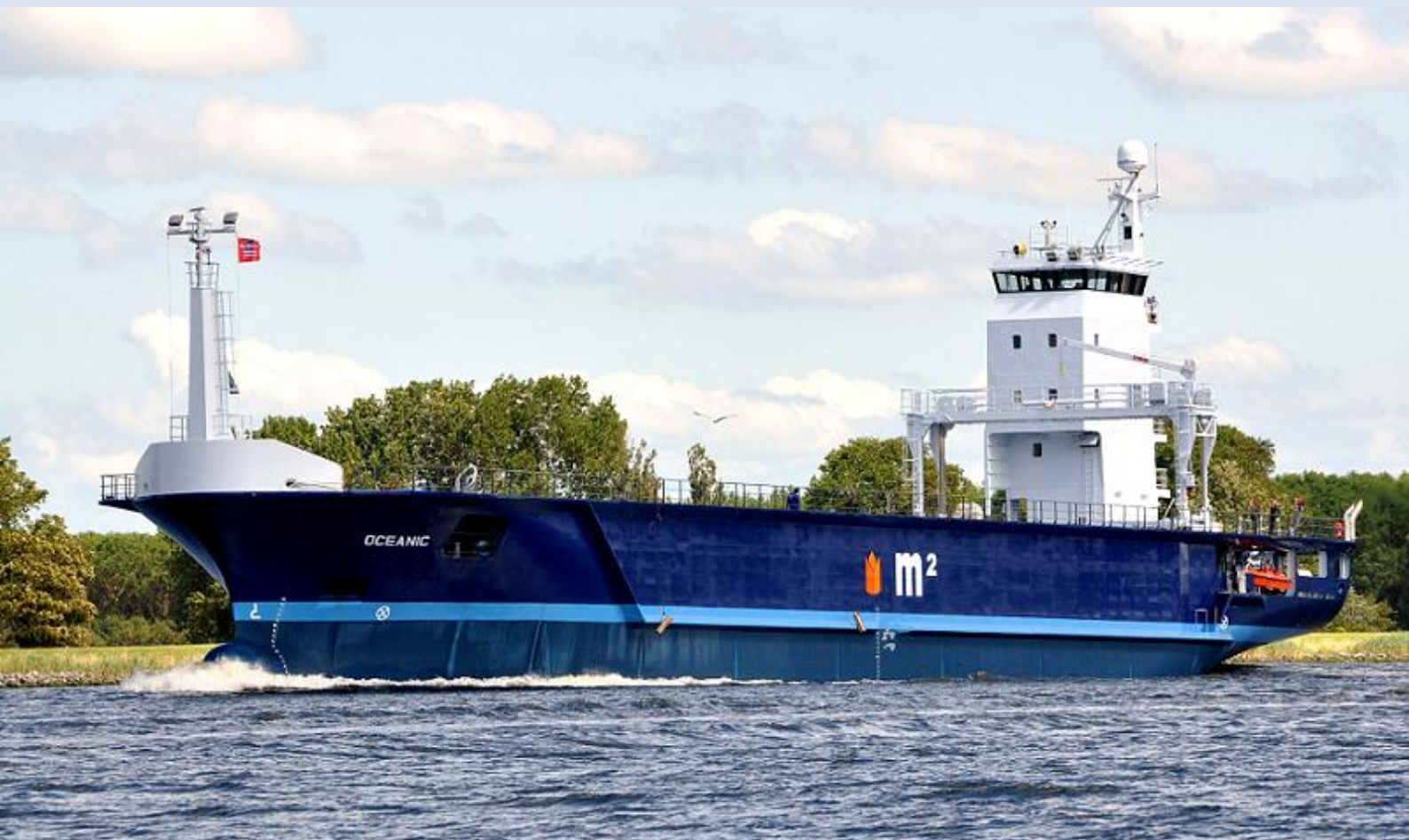
OCEANIC 9624550, casco gebouwd bij Partner Sp.z.o.o. te Stettin voor Global Seatrade B.V., Urk, in beheer bij Hartman Seatrade (Hartman Marine Group B.V.), 2.999 BRT, 3.750 DWT, roepsein PBYH, 92,90 x 14,75 meter. 15-4-2012 passage Kieler Kanaal met de sleepboten TAUCHER O. WULF 5 en TAUCHER O. WULF 8, 20-4-2012 gearriveerd te IJmuiden achter de sleepboot TAUCHER O. WULF 5 (6907169, Otto