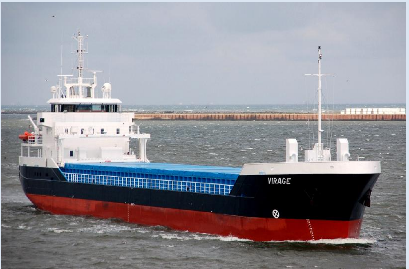
19-7-2012, te IJmuiden tijdens een reis van Tofte, via de Middensluis, naar de Mercuriushaven, Amsterdam.