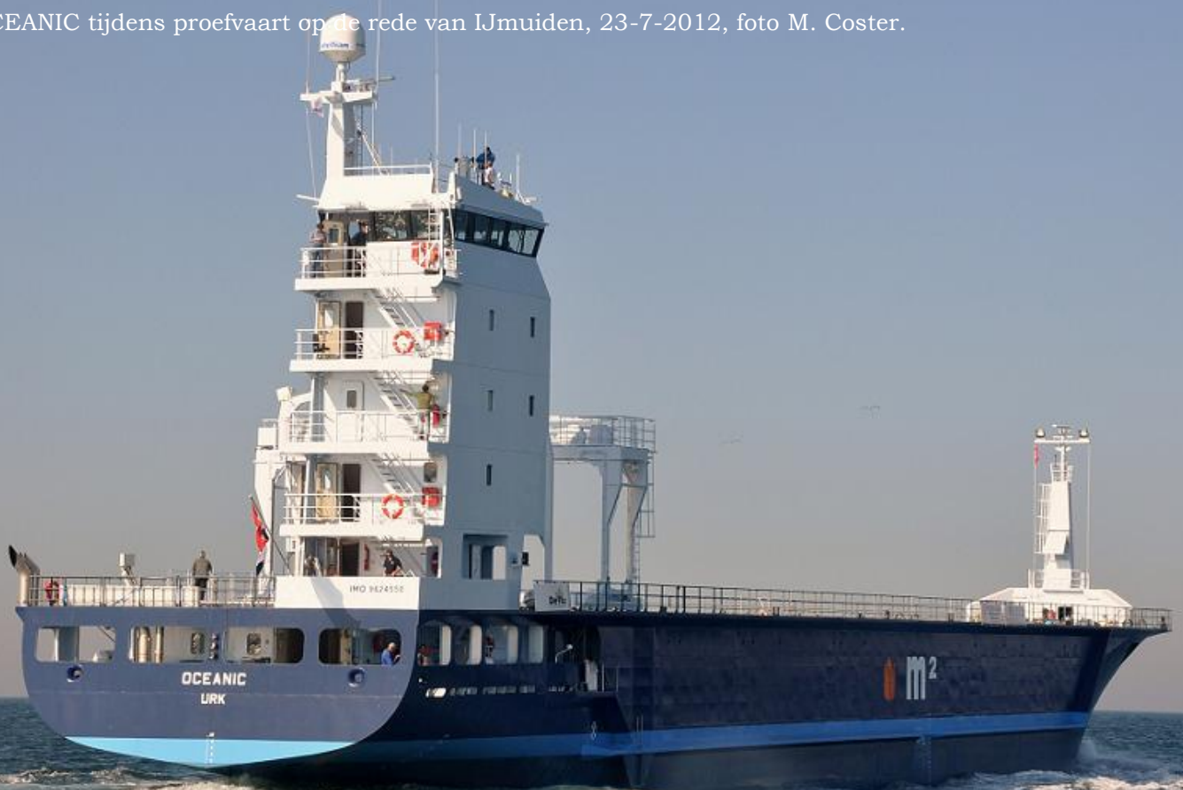
OCEANIC tijdens proefvaart op de rede van IJmuiden, 23-7-2012