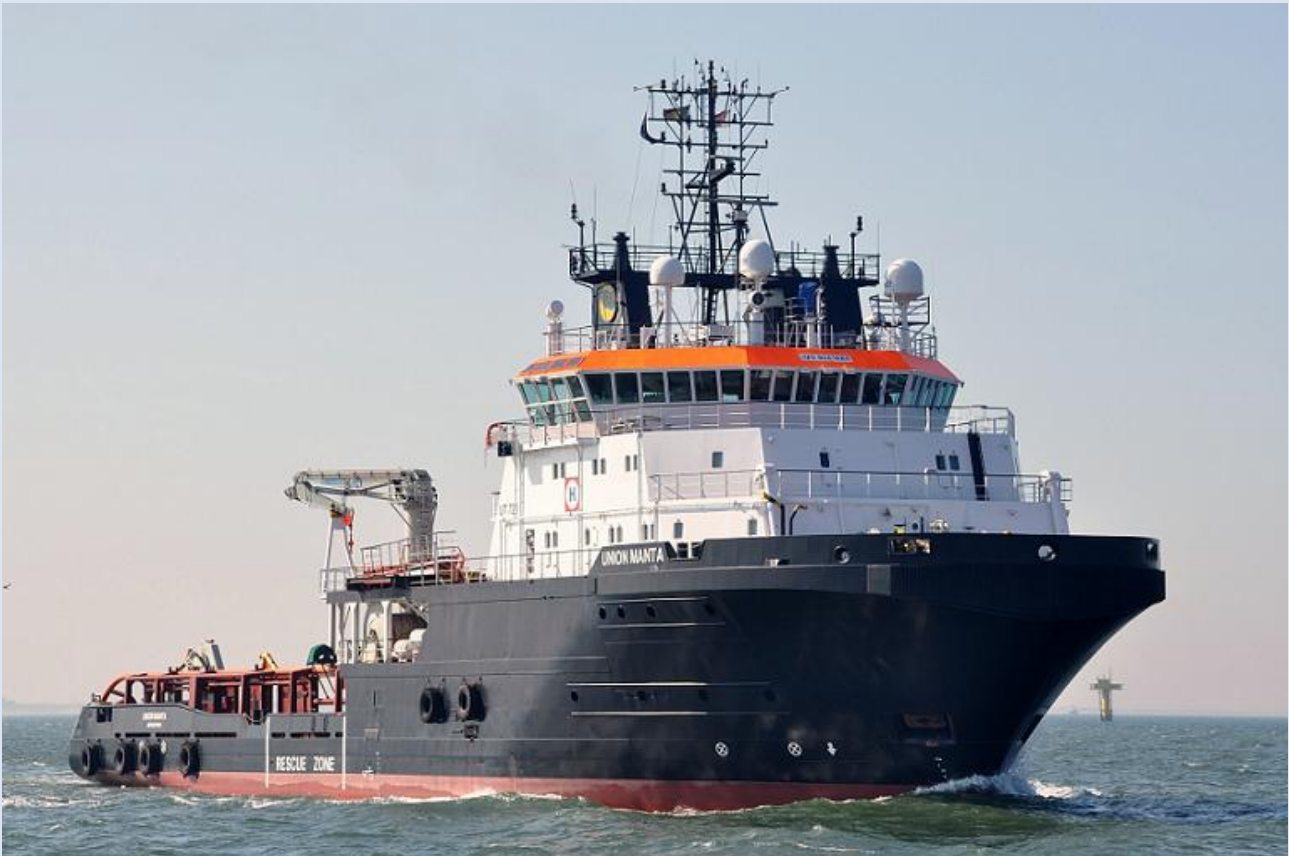
UNION MANTA 9261487, 23-7-2012 op de rede van IJmuiden tijdens een reis van IJmuiden naar Rotterdam.