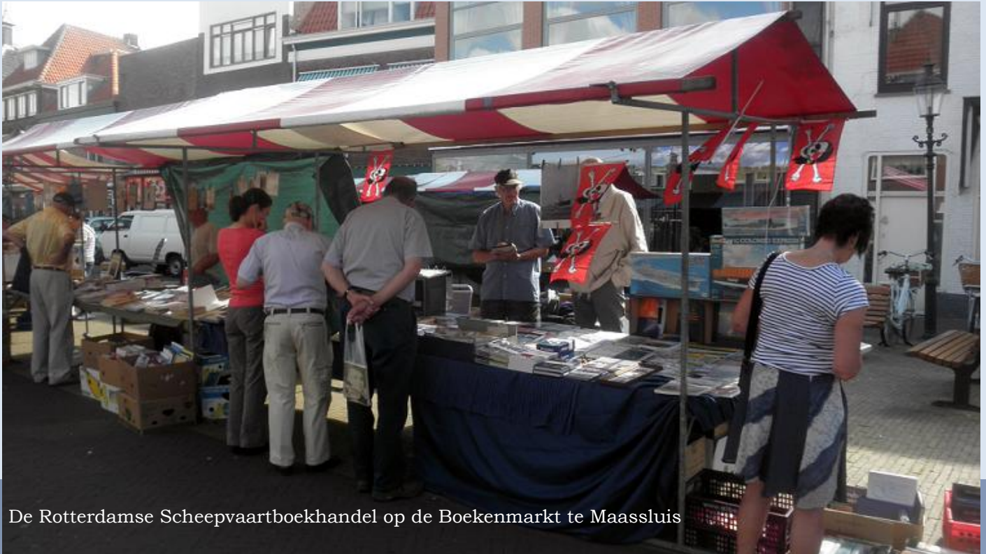
De Rotterdamse Scheepvaartboekhandel op de Boekenmarkt te Maassluis

Ook maken zij zich zorgen over de opslag van gevaarlijke stoffen. Bron: Raad van State, 23.7.12, tip: http://koopvaardij.blogspot.nl , 22-4-2012, Vulcaanhaven, Vlaardingen).