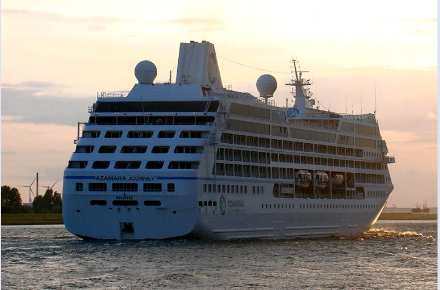
AZAMARA JOURNEY 9200940, 15-7-2012, passage Maassluis

Het cruiseschip was het eiland te dicht genaderd, had een rots geraamd en was met 4.200 passagiers en bemanningsleden aan boord gekapseisd. (Bron: hln.be, 21/07/12,).