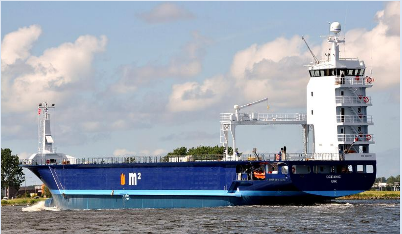
20-7-2012, Noordzeekanaal t.h.v. Snowplanet tijdens een reis van Urk naar Beverwijk.

Wulf G.m.b.H. & Co. K.G., Rostock, bouwjaar 1968, 154 BRT, 971 kW), met assistentie van de sleepboot TELSTAR, afgemeerd te Velsen Grote Hout, 21-4-2012 gearriveerd te Urk, afgebouwd bij Hartman Marine Shipbuilding B.V. te Urk onder bouwnummer 5, 20-7-2012 vertrokken van Urk naar Beverwijk.