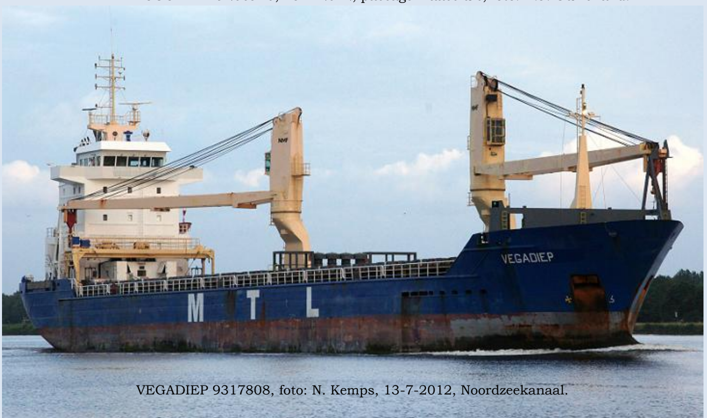
VEGADIEP 9317808, 13-7-2012, Noordzeekanaal.