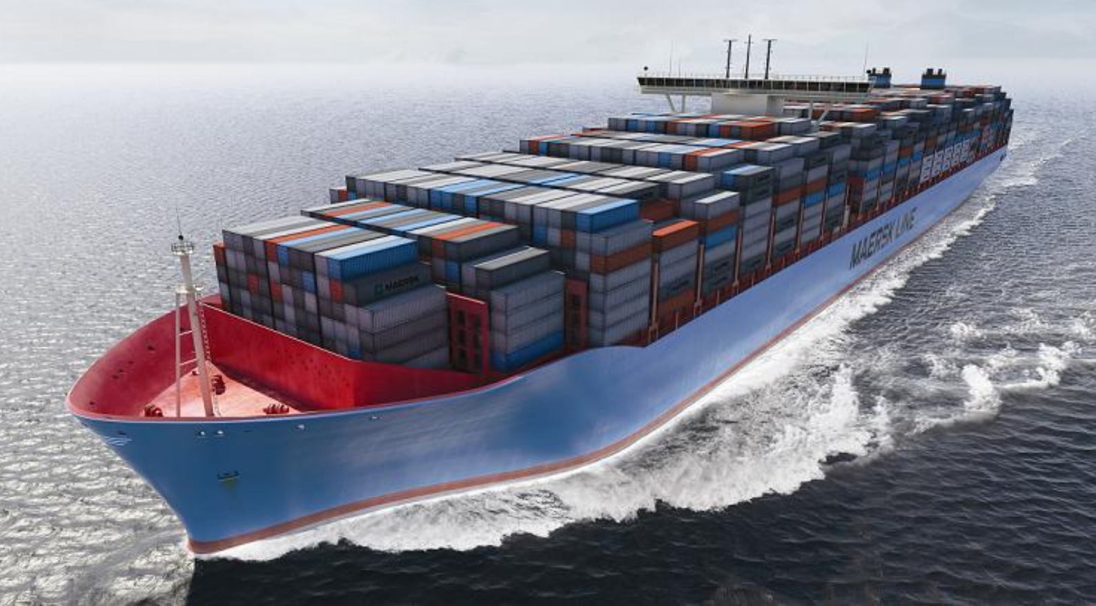
Type: Triple-E afbeelding: Maersk

particuliere beveiligers binnen twee dagen ter plaatse zijn, bij de marine duurt dat twee weken. (Bron: Schuttevaer, Willem de Niet, 19-7-2012).