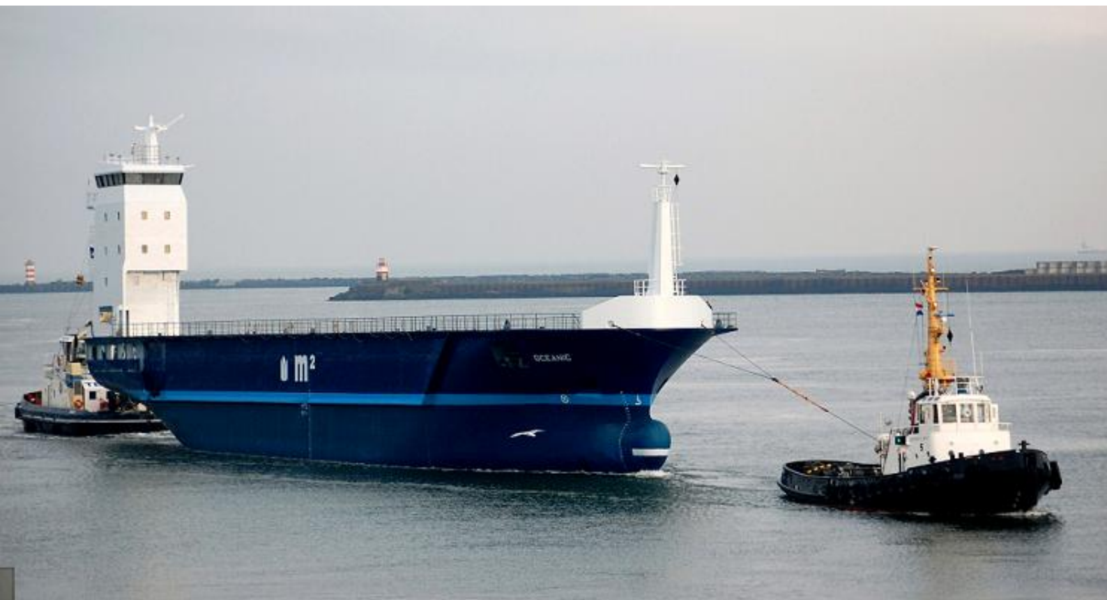
Aankomst OCEANIC te IJmuiden, foto: R. Coster

2.999 BRT, 3.750 DWT, 92,90 x 14,75 meter. 15-4-2012 passage Kieler Kanaal met de sleepboten TAUCHER O. WULF 5 en TAUCHER O. WULF 8, 20-4-2012 gearriveerd te IJmuiden achter de sleepboot TAUCHER O. WULF 5 (6907169, Otto Wulf G.m.b.H. & Co. K.G., Rostock, bouwjaar 1968, 154 BRT, 971 kW), met assistentie van de sleepboot TELSTAR, afgemeerd te Velsen Grote Hout, 21-4-2012 gearriveerd te Urk, afbouw bij Hartman Marine Shipbuilding B.V. te Urk onder bouwnummer 5.