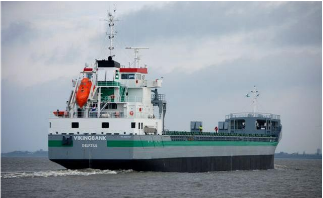
VIKINGBANK, vertrek van Delfzijl op de proefvaart