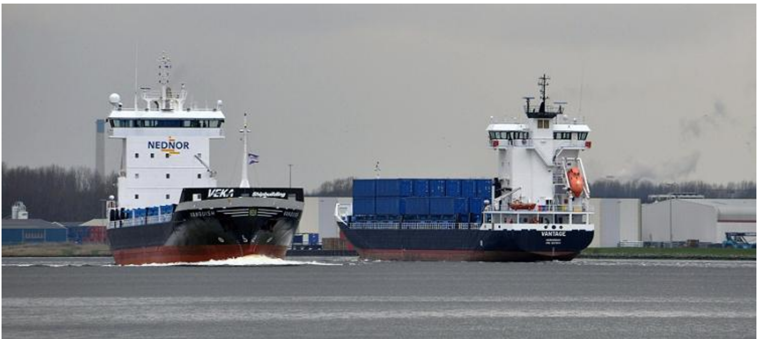
Passage VANQUISH van zusterschip VANTAGE, 20-4-2012, IJmuiden.

9-2011 (e) naam gewijzigd in VANQUISH, roepsein PHOW, 15-7-2011 ingedokt te Lemmer, 13-10-2011 uitgedokt, 10-4-2012 van Lemmer, via Amsterdam naar Zuidertoeleidingkanaal, Cruiseterminal, IJmuiden, 12-4-2012 proefvaart, 16-4-2012 (BV) opgeleverd aan Vanquish Shipping B.V., thuishaven: Werkendam, in beheer bij NedNor B.V., Groningen, 3.871 BRT, 1.333 NRT, 4.800 DWT, 6.648 m 3 , 93,24 x 15,85 x . x 5,850 meter, 4.457 EPK, 3.280 kW, Wärtsilä, 15 kn. 21-4-2012 vertrokken van de Cruisekade te IJmuiden, via de middensluis naar de Minervahaven Wachtsteiger, Amsterdam om daar te laden voor Ipswich, Engeland.