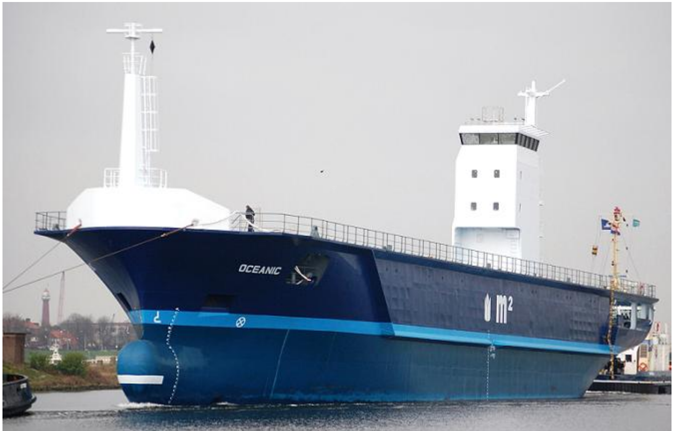
OCEANIC, voor en na de Middensluis te IJmuiden, foto's R. en M. Coster.