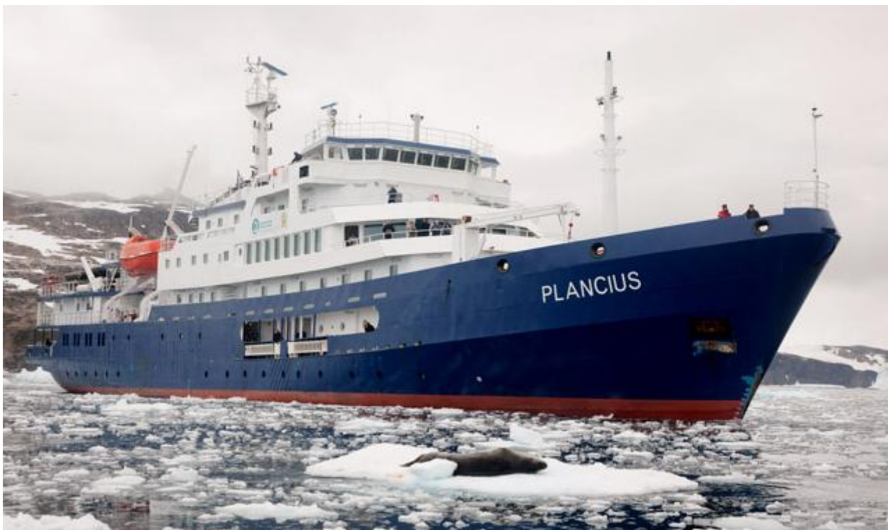
Gestrande vogelspotters naar Montevideo