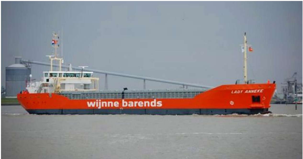
LADY ANNEKE, vertrek van Delfzijl voor de proefvaart

1.015 EPK, 10 kn., 5-4-2012 verhaald van de werf naar Delfzijl met de sleepboten GYAS en WATERPOORT, 19-4-2012 om 09:00 uur vertrokken voor de 1e proefvaart op de Eems, bij vertrek assisteerden de Bijma sleepboten GRUNO III en GRUNO IV.