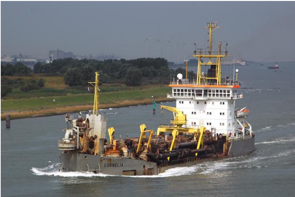
(, 26-8-2008, Nieuwe Waterweg).

afgelopen halfjaar is bovendien geïnvesteerd in de ombouw van de cutter TAURUS en zijn diverse investeringen gedaan bij Terminaldiensten, Harbour Towage en Salvage, Transport & Heavy Lift. Daarenboven is de bestelling geplaatst voor een eerste kabelleg/offshore-schip, recentelijk gevolgd door bestelling voor een tweede schip.