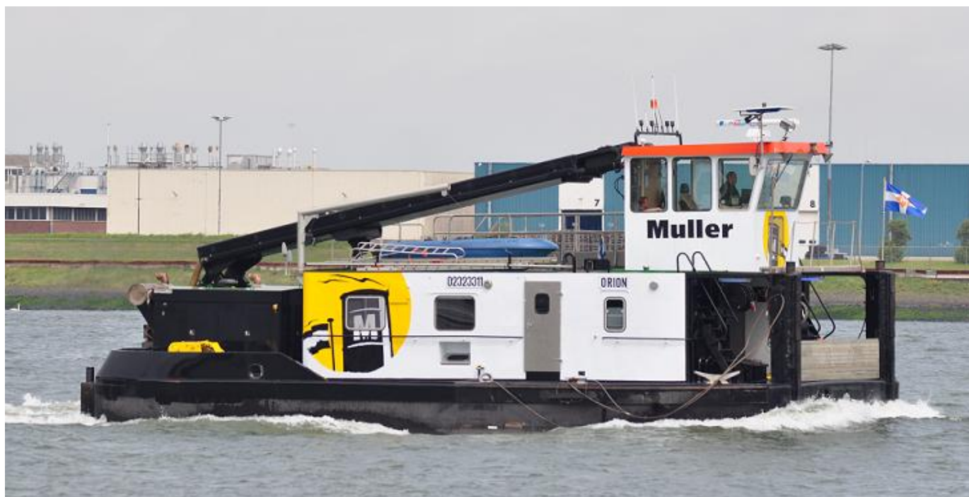
ORION 02323311, duwboot van Tebra Beheer B.V., Dordrecht. 2 x 480 PK, 353 kW, Caterpillar 3406 DI-TA. Gebouwd 1961 door N.V. Scheepswerf & Machinefabriek "De Biesbosch", Dordrecht (397) als SARRE voor Compagnie General de Navigation du Rhin, Straatsburg, 1962 verkocht aan Compagnie Francaise de Navigation du Rhin, Straatsburg, herdoopt SEMOIS, 1995 verkocht aan Muller Zwaartransport B.V., Dordrecht, herdoopt ORION, 2004 verkocht aan Tebra Beheer B.V., Dordrecht. (Foto: L. v.d. Meijden 2-8-2011).