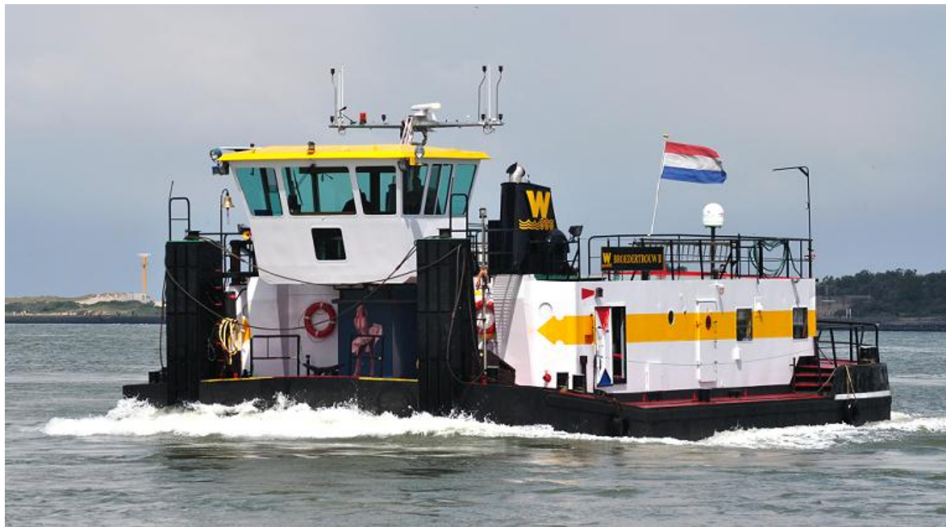
BRODERTROUW II - ENI 02317287 in de nieuwe kleuren met voorop mevrouw Monroe (Norma Jeane Baker), 20-7-2011 voor het Breediep.