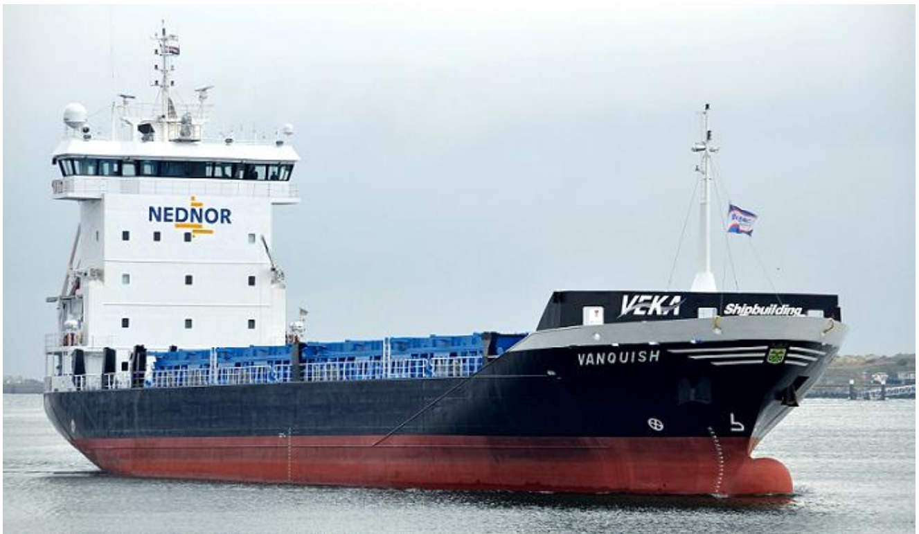
VANQUISH, IMO 9375135, 21-4-2012, IJmuiden

VECTIS ISLE, IMO 8903040 (NB-291), 30-6-1986 kiel gelegd, 5-9-1990 te water gelaten, 12-1990 opgeleverd door Cochrane Shipbuilders Ltd., Selby (166) als UNION MERCURY. 24-6-1991 herdoopt LESLEY-JANE C. 13-9-1993 herdoopt VECTIS ISLE. 1998 verkocht aan Carisbrooke Shipping C.V. 1 B.V., Groningen, in beheer bij Carisbrooke Shipping (Holland) B.V. 2000 vlag: Barbados. 2003 verkocht aan Vectis Shipping, Douglas-Isle of Man. 2005 verkocht aan Tonga Management Inc., Moroni, vlag: Comoros, in beheer bij South River Shipping Co. Ltd., Kherson, Oekraïne. 24-3-2022 van Burgas naar Rhodos. 25-3-2022 om 02:50 uur op 5 mijl Noord van Kumköy aan de ingang van de Bosporus, in aanvaring gekomen met het vissersschip MASALLAH, beide schepen liepen schade op, de VECTIS ISLE aan BB achter, de MASALLAH aan het voorschip, Istanbul Ship Traffic Services Center stuurde de sleepboten KURTARMA 11 en MEHMETCIK en de reddingboot KIYI EMNIYETI 7 er naar toe, 25-3-2022 VECTIS ISLE om 06:00 uur LT op Bosporus Anchor Zone voor onderzoek. 26-3-2022 vertrokken naar Limassol. 12-10-2022 bij de ingang van de Zwarte Zee aan de Bosporus voor de kust van Türkeli Feneri in aanvaring gekomen met een vissersschip, het Directoraat-Generaal Kustveiligheid zette twee sleepboten en een reddingsboot in, niemand raakte gewond, er ontstond schade aan het ten anker liggende vrachtschip. 12-10-2022 afgemeerd te Poti. 16-10-2022 vertrokken van Poti naar Sulina.