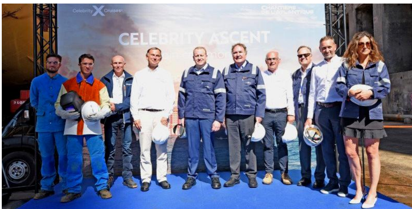
Celebrity Cruises viert mijlpaal voor CELEBRITY ASCENT

ARVIA, IMO 9849693 (NB-290), 18-2-2021 in aanbouw onder bouwnummer MEYER WERFT 716, 15-2-2022 kiel gelegd, 27-8-2022 (te water) uitgedokt, 12-2022 geplande oplevering aan Carnival PLC, vlag: United Kingdom, in beheer bij P&O Cruises. 185.206 GT, 5.200 passagiers.