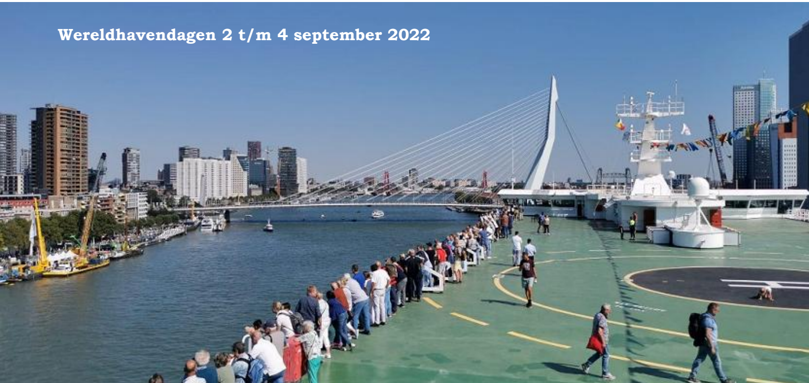
PRIDE OF ROTTERDAM, 3-9-2022 t.h.v. Westerkade

Dit jaar vierden we op 2, 3 en 4 september de 45ste editie van de Wereldhavendagen in Rotterdam. Met een voller-dan-vol programma en prachtig weer was het genieten voor iedereen. Het publiek liet zich verwonderen door de veles nautische shows op het water van de Maas, wandelde langs de kades en genoot van de prachtige schepen. (WHD).