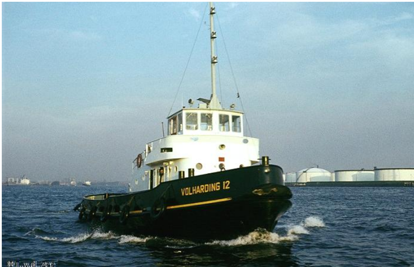
VOLHARDING 12 in de kleuren van Smit Vos B.V. t.h.v. Vlaardingen