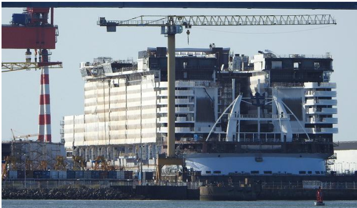
WONDER OF THE SEAS, IMO 9838345, 9-10-2019) kiel gelegd onder bouwnummer ATLANTIQUE CHANTIERS C34, 20-5-2021 geplande oplevering aan Royal Caribbean Cruises Ltd., Miami FL, vlag: Bahamas, 19.750 DWT. (, 19-7-2020 in aanbouw te Saint-Nazaire).