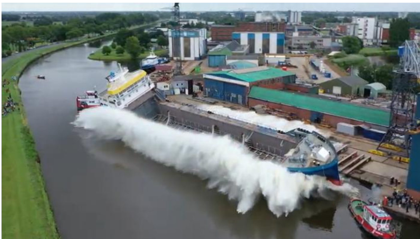
GALE, IMO 9876335, gastanker, 11-2019 kiel gelegd, 8-7-2020 te water gelaten bij Ship and Steelbuilding B.V., Foxhol onder bouwnummer 841, assistentie van de sleepboten WATERLELIE en GYAS, in aanbouw voor Chemgas Shipping B.V., Rotterdam (Chemgas Holding B.V.), 10-2020 geplande oplevering. 2.999 GT, 2.450 DWT. (Foto: Marcel Klip 112hoogezand.nl).