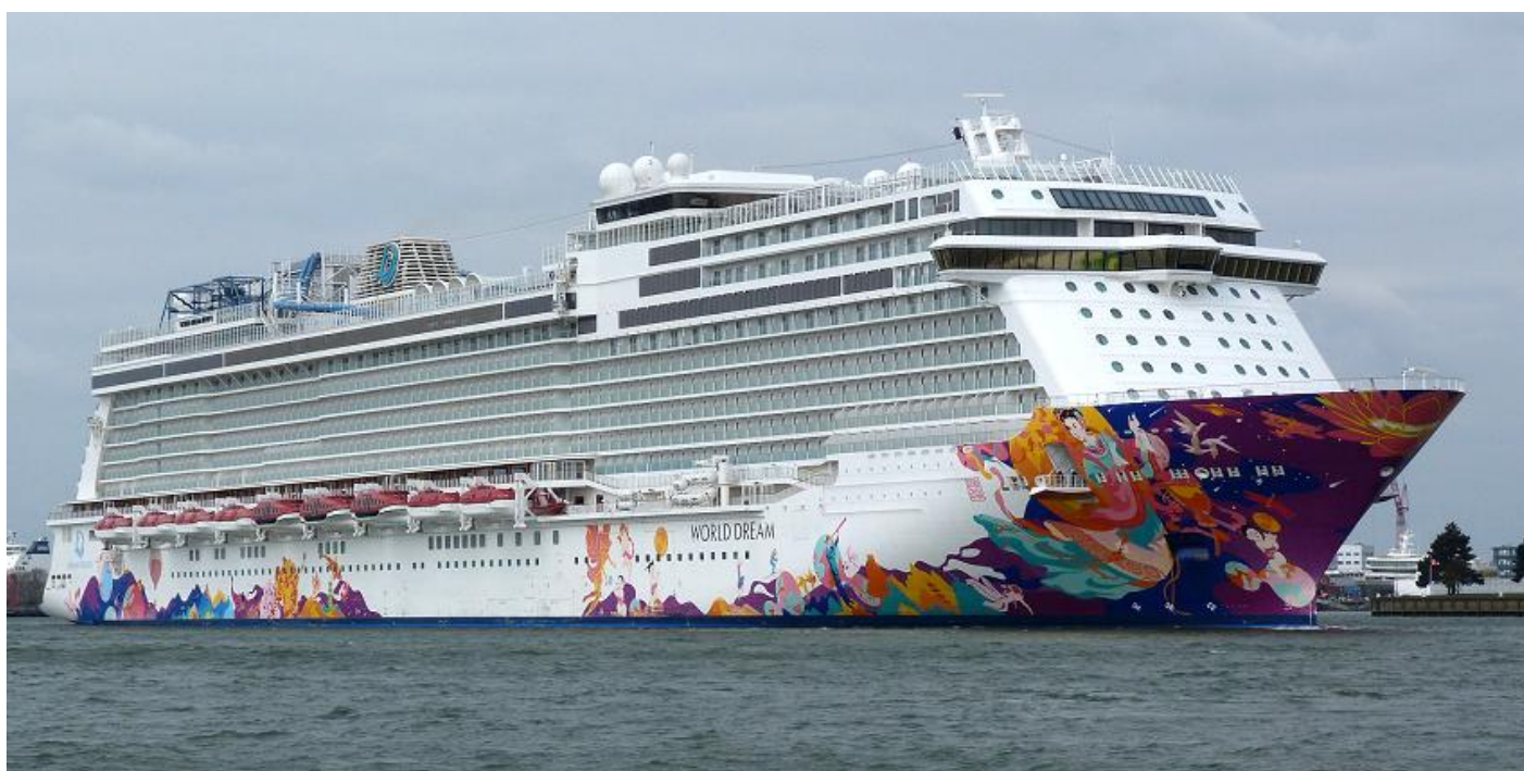
WORLD DREAM, IMO 9733117, (NB-267), 26-8-2017 te water (opgedreven) bij Meyer Werft, Papenburg als MEYER WERFT 712, 17-9-2017 van Papenburg, 18-9-2017 in de Eemshaven, 21-9-2017 van de Eemshaven op proefvaart, 24-9-2017 terug in de Eemshaven, 28-9-2017 vertrokken op de proefvaart o.a. in het Skagerak, 2-10-2017 terug in de Eemshaven, 12-10-2017 vertrokken uit de Eemshaven voor een proefvaart op de Noordzee, 14-10-2017 ETA Eemshaven, 14-10-2017 terug in de Eemshaven, 25-10-2017 van de Eemshaven naar Bremerhaven, 26-10-2017 te Bremerhaven, 26-10-2017 opgeleverd aan Chinese Percept Ltd., Bahamas (C6BO4), in beheer bij Star Cruises, Kuala Lumpur (Dream Cruises). 150.695 GT, 15.370 DWT. 26-10-2017 van Bremerhaven naar Gibraltar, 29-10-2017 te Gibraltar. 3-11-2017 te Port Said. 17-11-2017 ETA te Shanghai, 19-11-2017 ETA te Guangzhou, China. 2-4-2020 verhaald van Schiedam naar de Waalhaven, Rotterdam en opgelegd. 26-7-2020 van de Waalhaven naar Scheveningen Anchorage.