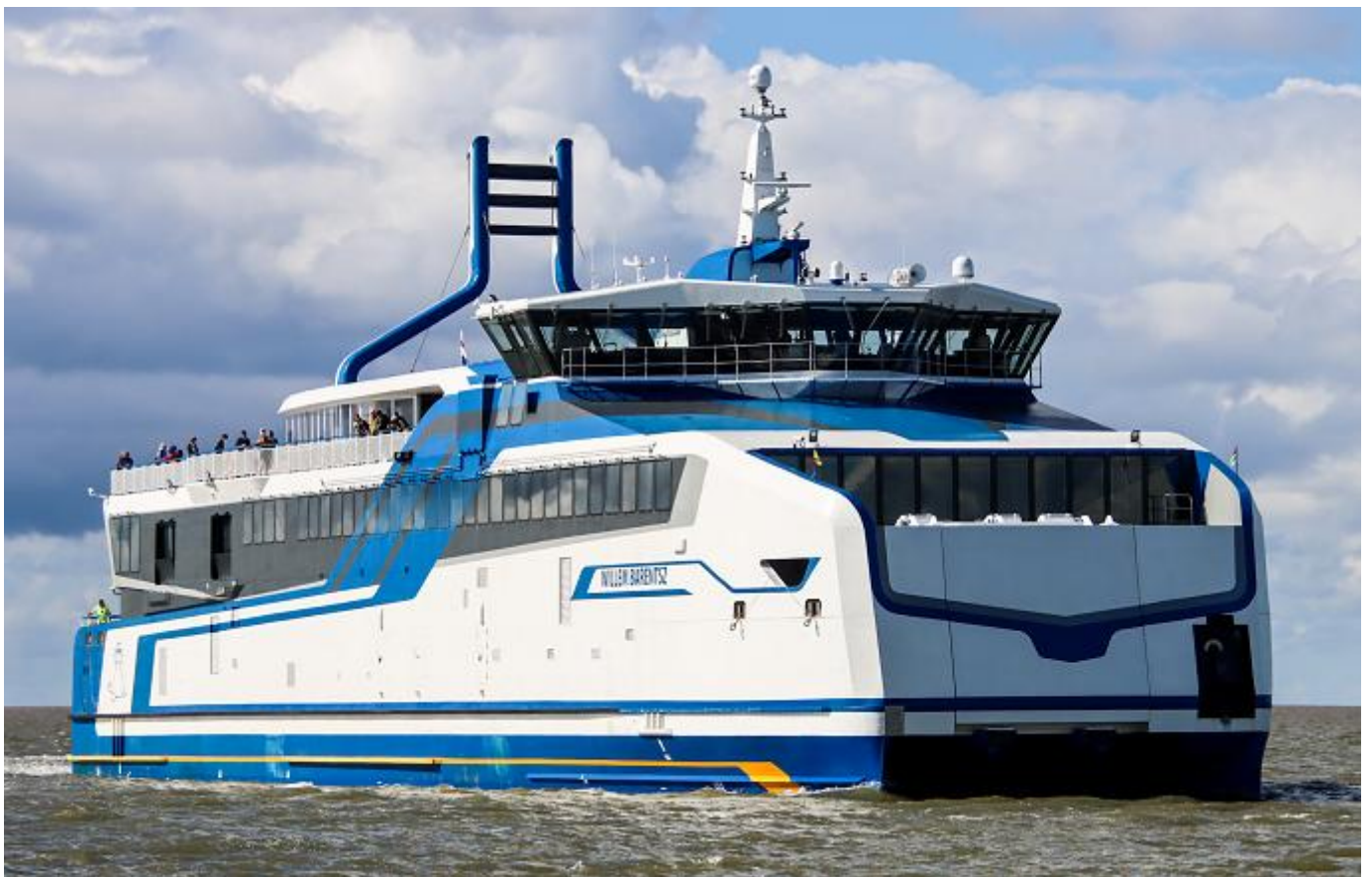
WILLEM BARENTSZ, 10-7-2020