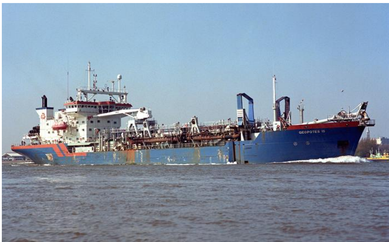
GEOPOTES 15, IMO 8414790, 2-12-1985 opgeleverd door Verolme Scheepswerf Heusden B.V., Heusden (998) als GEOPOTES 15 aan Volker Stevin Bagger Maatschappij B.V., Rotterdam. Roepsein PEHO. 10.188 BRT, 15.057 DWT. 15,3 kn. 11.160 kW. 1992 verkocht aan Nederlandsche Overzee Baggermaatschappij B.V., Rotterdam, in beheer bij Hollandsche Aanneming Maatschappij B.V., Rijswijk. 1-2006 verkocht aan Sleephopperzuigers IV B.V., Rotterdam, in beheer bij Van Oord Ship Management B.V., Rotterdam. 17-6-2020 op Santos Anchorage. 18-6-2020 op Rio de Janeiro Anchorage. 10-7-2020 te Cadiz. 2020 verkocht voor de sloop naar Turkije, 17-7-2020 ETA te Aliaga, 19-7-2020 gearriveerd te Aliaga, Turkije, 22-7-2020 te Aliaga op het strand gezet om gesloopt te worden.