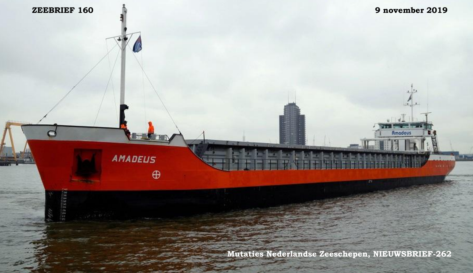
Mutaties Nederlandse Zeeschepen, NIEUWSBRIEF-262