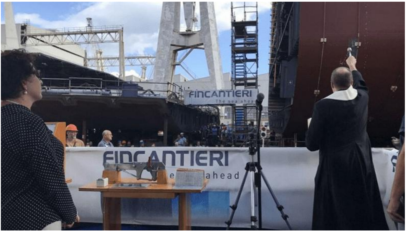
RYNDAM, IMO 9837470, 13-3-2019 (e) in aanbouw onder bouwnummer FINCANTIERI VENICE 6278 voor Carnival Corp., Rotterdam, in beheer bij Holland America Line N.V., Seattle WA. 5-2021 geplande oplevering. 99.500 GT, 9.000 DWT.