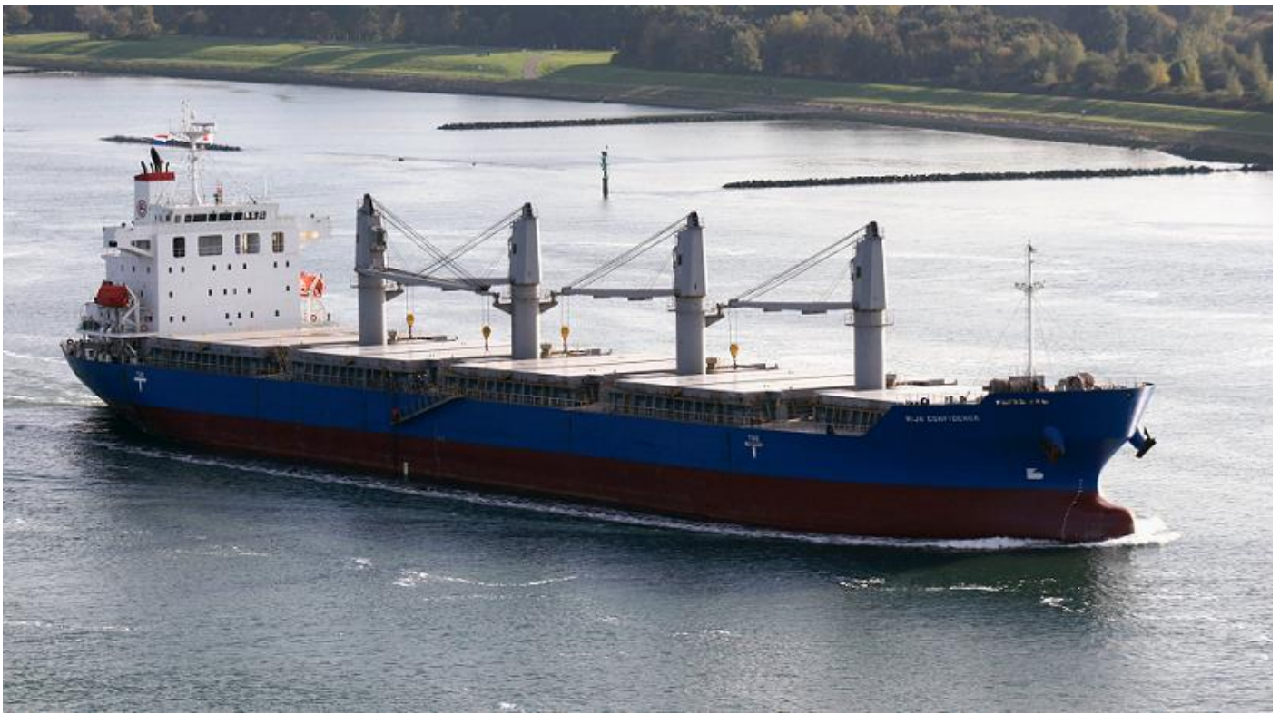
RIJN CONFIDENCE, foto: R.P. van de Wetering, 20 oktober 2018 uitgaand Scheur (Nieuwe Waterweg) bij Maassluis met bestemming Szczecin