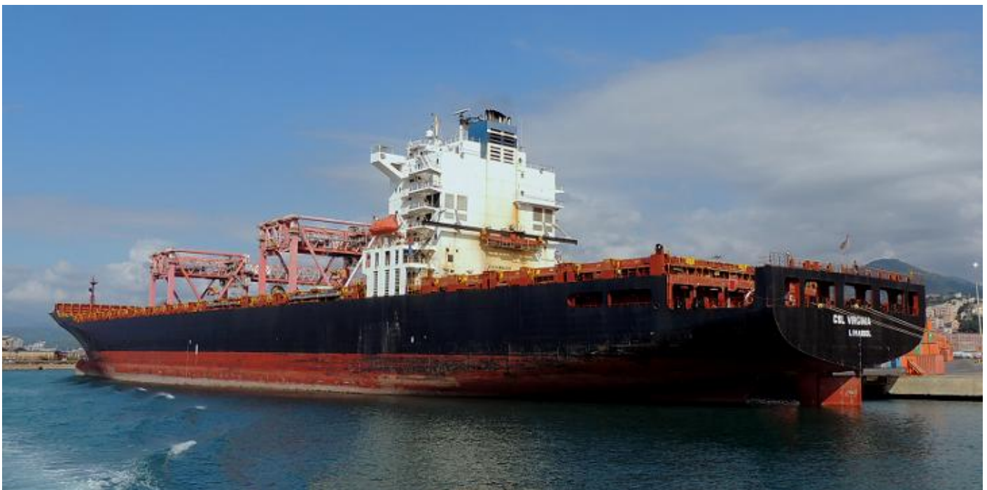
m.s. CSL VIRGINIA, 23-9-2018, Genua

ULYSSE, IMO 9142459, 9142459, Op 7 oktober 2018 is de ULYSSE (1997, 17.907 GT) van Cotunav in aanvaring gekomen met de CSL VIRGINIA (IMO 9289568, 2005-APL VIRGINIA, 2010-VIRGINIA, 2014-CSL VIRGINIA, 54.592 GT), die ten anker lag Pas na vijf dagen is de ULYSSE losgekomen van de CSL VIRGINIA. Door de aanvaring is enige olie in zee gekomen.