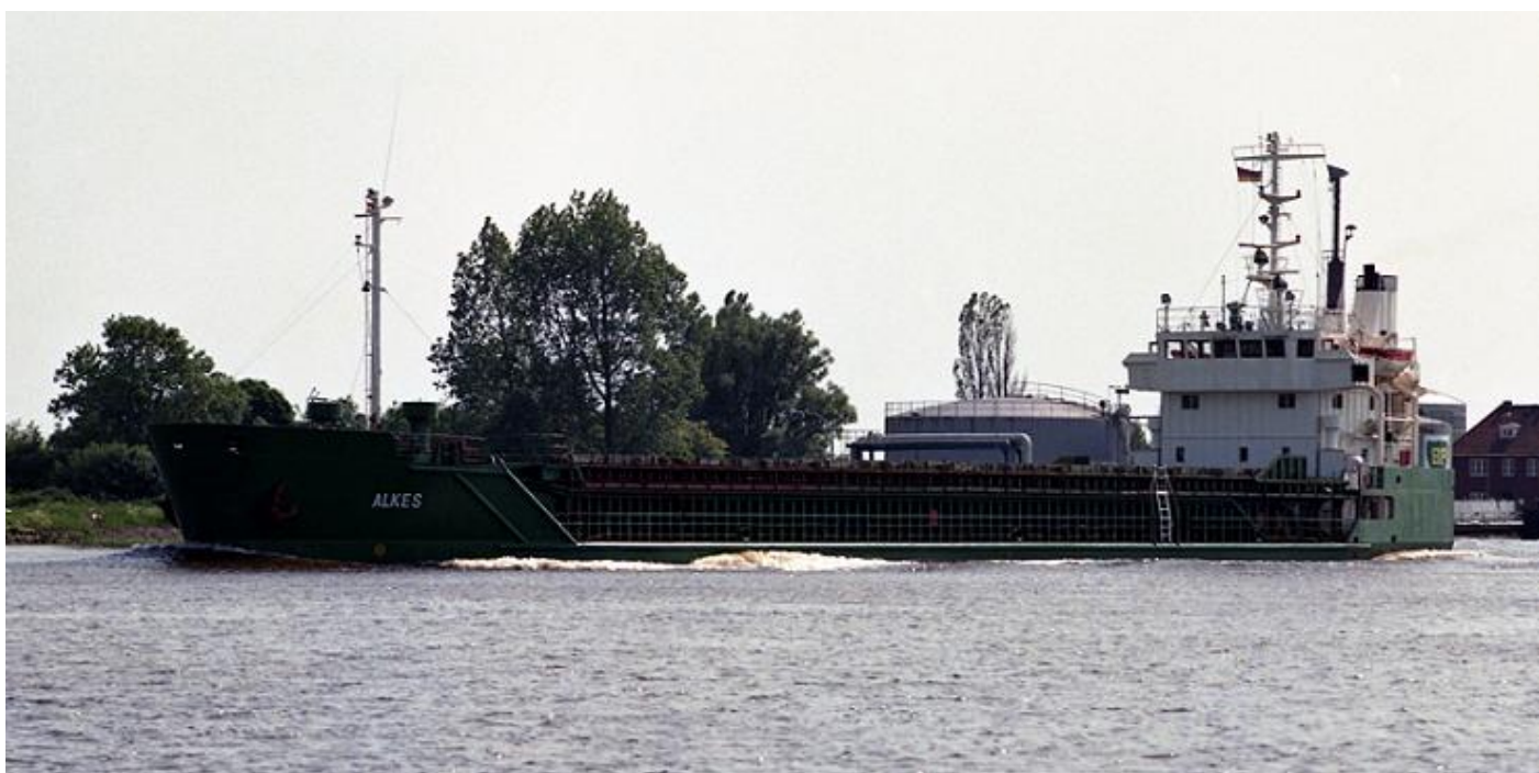
ALKES, ex MINILAND, foto: GF-TVDZ, 1988