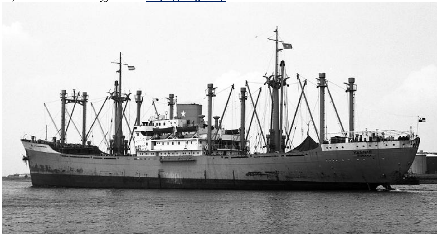
KESNAR ex ALKES, 23-7-1978 op de Nieuwe Maas t.h.v. Vlaardingen.

De schepen van Nigoco, deel 2, 1954 - 1991. Van Nievelt, Goudriaan & Co.'s Stoomvaart Maatschappij N.V., Rotterdam, Voorzien van alle technische gegevens en levensloop van de overige schepen. 400 zwart/wit foto's met zowel eigen scheepsnaam als met verkoop namen. Gelijmd en uitgevoerd in full colour gelamineerde harde kaft, 260 blz., formaat 15 x 20 cm, ISBN 978-90-79152-18-6. Vaste verkoop prijs € 25,95. Zie voor de verkrijgbaarheid https://stegro.nl/