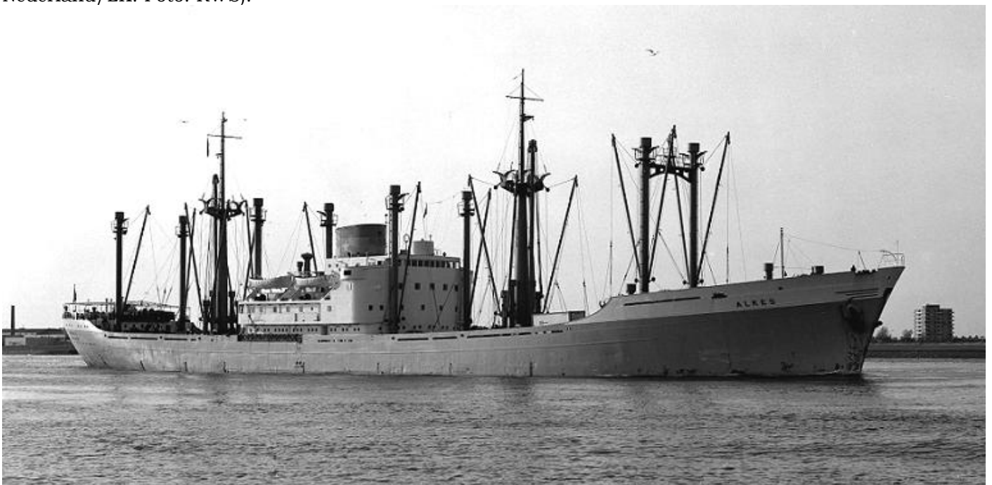
ALKES van N.V. Van Nievelt, Goudriaan & Co.'s Stoomvaart Maatschappij.

Het project is een samenwerkingsverband van het ministerie van Infrastructuur en Waterstaat, de provincie Noord-Holland, de gemeente Amsterdam, Port of Amsterdam en de gemeente Velsen. Aannemersconsortium OpenIJ bouwt de nieuwe zeesluis in opdracht van Rijkswaterstaat.