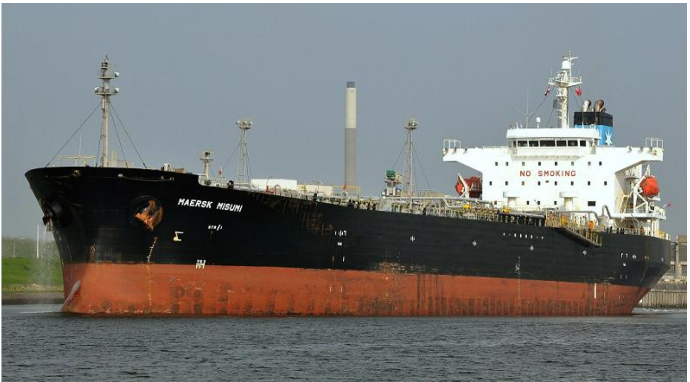
m.t. MAERSK MISUMI, 25-4-2014