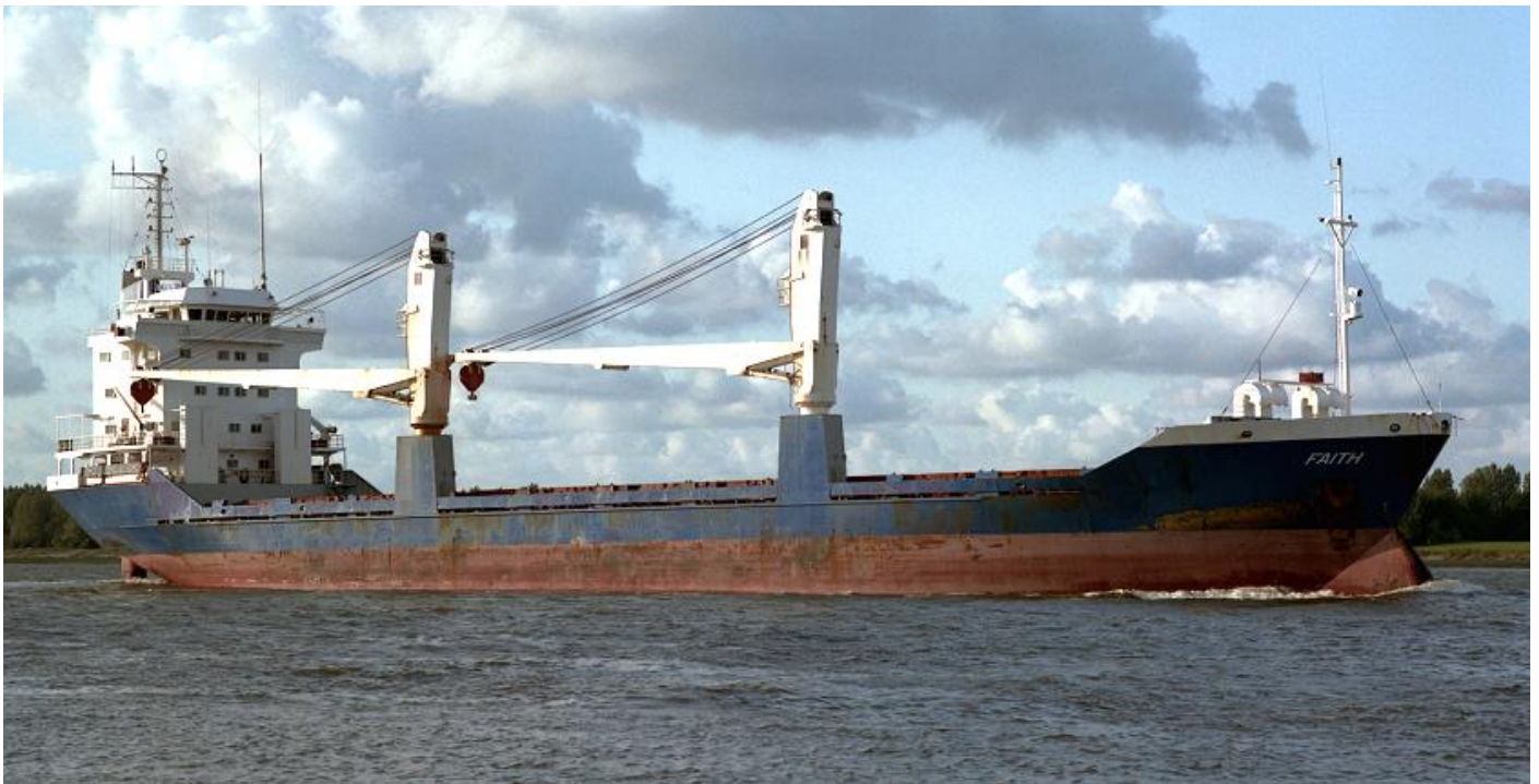
SAMSUN FAITH, IMO 8322105 (NB-173), 5-7-1985 opgeleverd als SAMSUN FAITH aan Holtrade Shipping B.V., Heerenveen, in beheer bij Holwerda Scheepvaart B.V. 1985 herdoopt FRISIAN FAITH. 1985 herdoopt ESA 1. 1985 herdoopt FRISIAN FAITH., 1986 herdoopt AKAK FAITH. 1986 herdoopt FRISIAN FAITH. 1986 verkocht aan Riddership B.V., in beheer bij Holwerda Scheepvaart B.V. 1987 verkocht aan Ridderveer B.V., Slikkerveer, in beheer bij General Shipping & Chartering Services V.o.F. "GENCHART", herdoopt FAITH. 1995 herdoopt TIGER STREAM. 1996 herdoopt FAITH. 1999 verkocht aan Subiaco (S) Pte. Ltd., Melbourne, in beheer bij ASP Ship Management Pty. Ltd., Melbourne, vlag: Singapore, 1999 herdoopt ACHILLES. 2001 herdoopt CAPITAINE D'URVILLE. 4-9-2001 herdoopt SOFRANA D'URVILLE. 23-4-2003 herdoopt ACHILLES. 6-11-2003 (e) herdoopt NT EXPRESS. 24-10-2005 (e) herdoopt LIHIR CHIEF. 12-12-2005 verkocht aan Pacific Express Line Ltd., Singapore, in beheer bij Ocean Shipping Pty. Ltd., Townsville Qld., Australië, 28-12-2006 (e) herdoopt ACHILLES. 28-8-2009 verkocht aan P.T. Meratus Line, Indonesië, 28-8-2009 in beheer bij Oceanic Container Lines Inc., Manilla. 19-12-2010 (e) verkocht aan Oceanic Container Lines Inc., Manilla-Filippijnen, roepsein 4DEM8, herdoopt OCEAN MIGHTY. 2018 verkocht voor sloop naar Chittagong. 2018 vlag: Mongolië, roepsein JVZB6, 2018 herdoopt WEST OCEAN 15. 12-10-2018 van Cebu naar Chittagong, 2-11-2018 te Chittagong, 8-11-2018 te Chittagong op het strand gezet om gesloopt te worden.