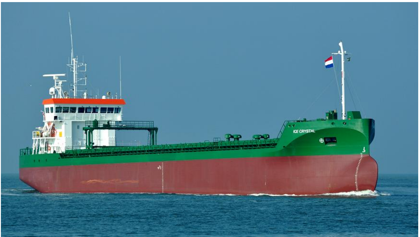
ICE CRYSTAL, 21-2-2018, IJmuiden