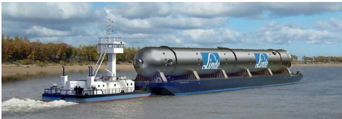
Een PusherTug 2612SD met Stanpontoon 8916SD op de Amur.

Damen Shipyards heeft een grote order in de wacht gesleept van het Duitse Combi Lift voor de levering van 19 vaartuigen waaronder vier Multicats 2608SD en vier duw/sleepboten 2612SD van elk circa 26 meter lang. Verder zeven circa 90 meter lange Stan Pontoons 8916SD en vier zogeheten Side Floaters 8605SD drijflichamen. (Schuttevaer.nl, Gorinchem, 9 Juli 2017).