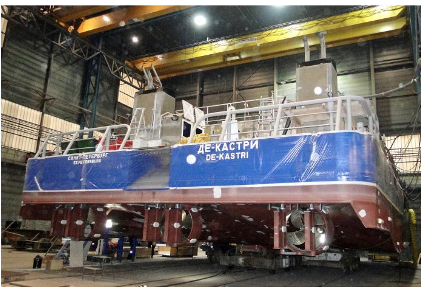
DE-KASTRI, IMO 9828510 in aanbouw, 20-11-2017