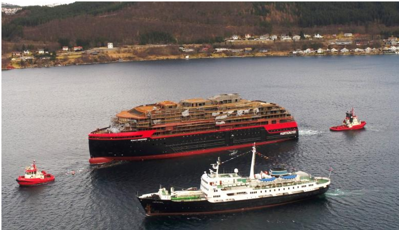
ROALD AMUNDSEN en LOFOTEN, 17-2-2018