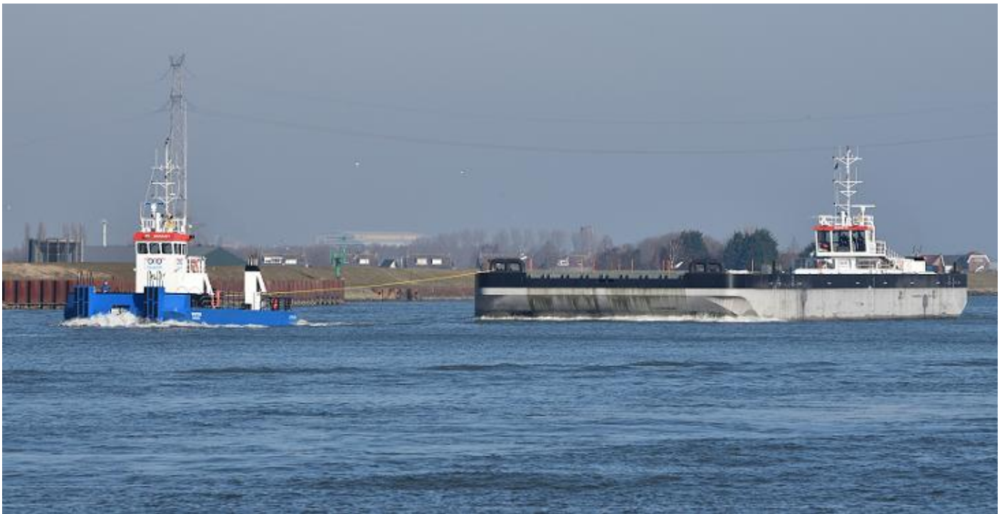
CHERNIGOVKA en DE-KASTRI op proefvaart met een ponton

Het complex is onderdeel van de levering van Russisch gas aan China via de “Power of Siberia”-pijplijn van Oost-Siberische gasvelden, die wordt aangelegd in vijf periodes en in 2024 gereed moet zijn. De casco's van de vier Multicats 2608SD (bouwnummers 571767-70, IMO 9828479, 9828481, 9828493 en 9828508) worden gebouwd bij Damen Shipyards Kozle Sp.z.o.o.. De gegevens zijn: 260 bt, L o.a. (l.l.) x B = 25,70 (23,95) x 12.00 meter. Voortstuwing door drie Caterpillar-hoofdmotoren, type C12, 1170 pk of 861 kW op drie schroeven. De casco's van de vier Pusher-Tugs 2612SD (bouwnummers 571773-76, IMO, 9828510, 9828522, 9828534 en 9828546) komen van Niron Staal BV, Amsterdam, waarna ze worden afgebouwd in Gorinchem en Hardinxveld. De gegevens van de duwbotten zijn: 230 bt, L o.a. (l.l.) x B = 25,90 (23,95) x 8,50 meter. Voortstuwing door twee Caterpillar-hoofdmotoren, type C12, 780 pk of 574 kW op twee schroeven. In het voorjaar van 2018 moeten de acht onder klasse van Bureau Veritas gebouwde vaartuigen naar Nikolayevsk worden verscheept. De zeven StanPontoons 8916SD en vier SideFloaters 8605SD worden gebouwd bij Damen Yichang Shipyard, Hubei.