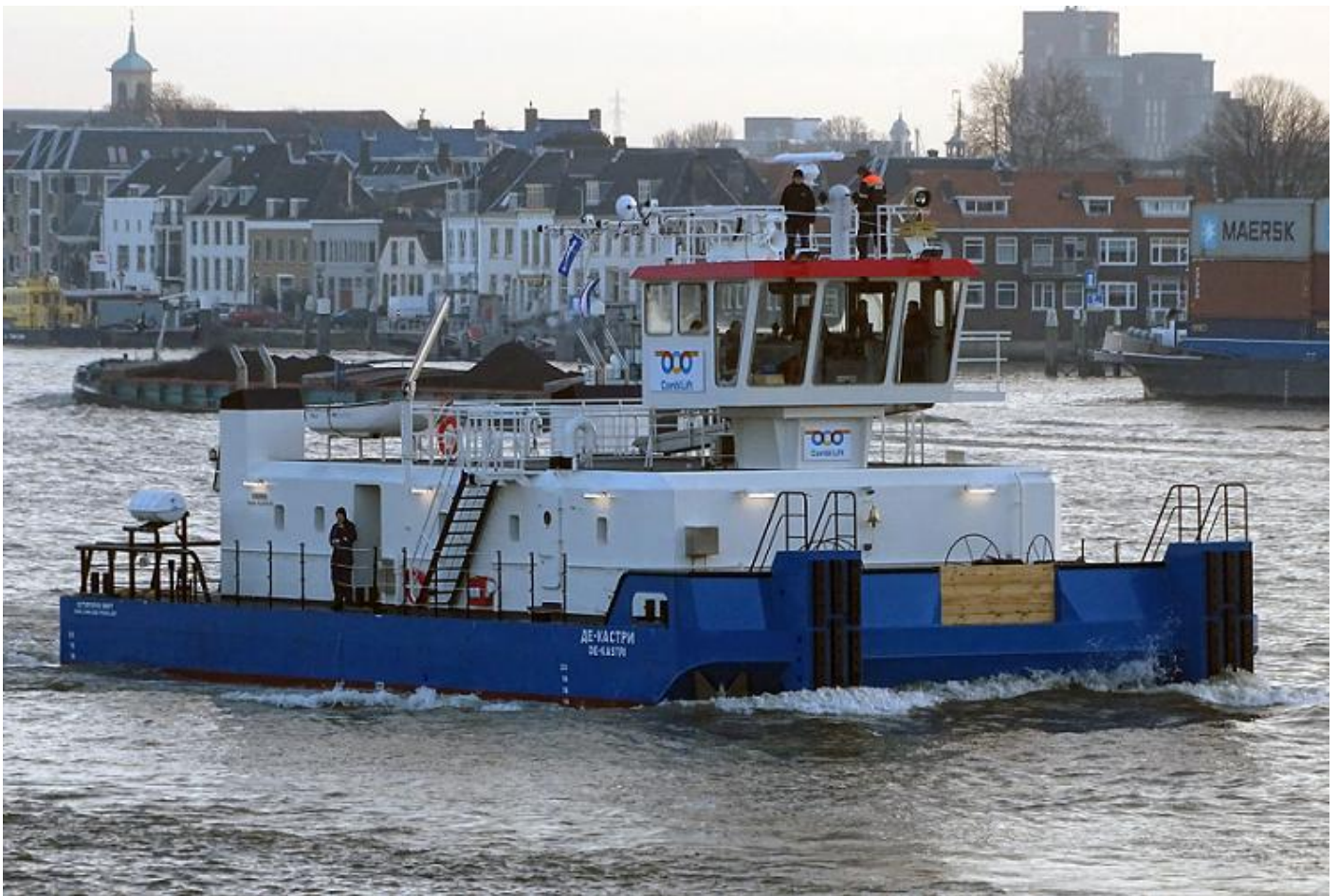
DE-KASTRI, passage Dordrecht/Zwijndrecht, foto: D. Henken, 8-2-2018