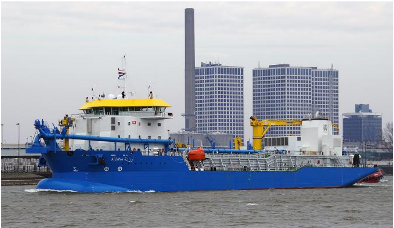
ARZANA, foto: Koos Goudriaan, 2-3-2018, Rotterdam, op weg naar Abu Dhabi