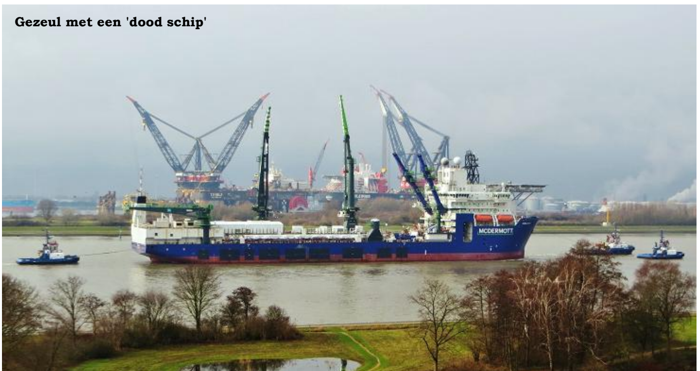
Gezeul met een 'dood schip'