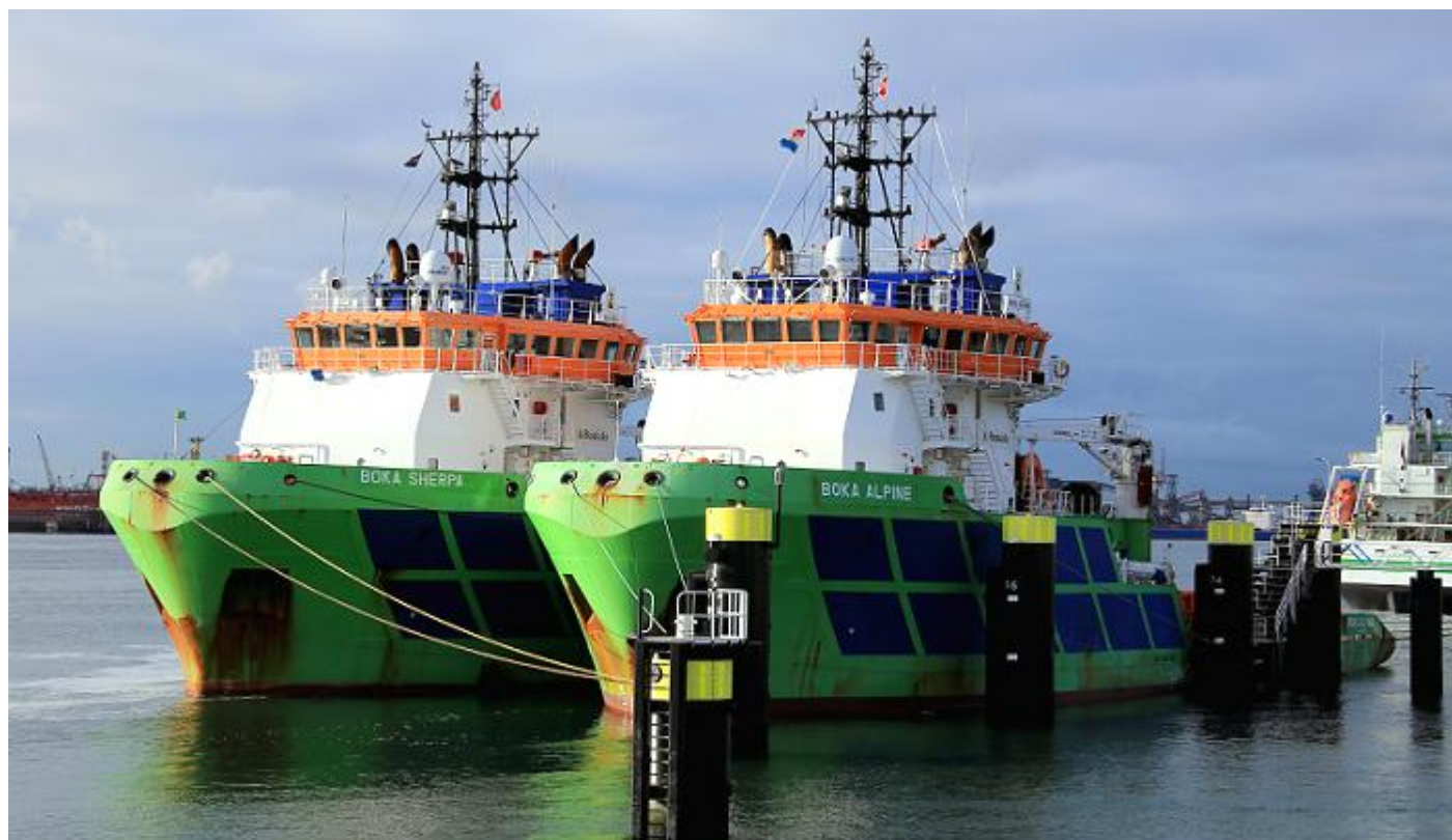
BOKA ALPINE en BOKA SHERPA