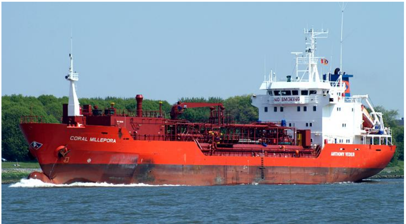
m.t. CORAL MILLEPORA

DINKELDIEP, IMO 9518983 (NB-177), 10-9-2008 kiel gelegd, 7-4-2011 te water gelaten, 15-8-2011 opgeleverd door Rong Cheng Shipbuilding Industry Co. Ltd., Shidao (RC22) als DINKELDIEP aan Spring Tide Shipping Co. Ltd., Cyprus, in beheer bij Intership Navigation Co. Ltd., Limassol, roepsein 5BFJ3, 4.220 GT, 5.507,5 DWT, 1.920 kW, Yanmar 6EY26, Yanmar Co. Ltd. NE-10. 4-2012 verkocht aan Spring Tide Maritime Ltd., thuishaven en vlag: Monrovia-Liberia, roepsein D5BQ5, in beheer bij Intership Navigation Co. Ltd., Limassol. 2015 beheer bij Intership Navigation Co. Ltd. en MTL Maritime Transport. 25-7-2016 in beheer bij Intership Navigation Co. Ltd., Limassol. 2-2017 herdoopt KALVOE. 28-11-2017 verkocht aan Spring Tide Shipping Co. Ltd., Cyprus, in beheer bij Intership Navigation Co. Ltd., Limassol. 2-2018 in beheer bij Schulte & Bruns Chartering G.m.b.H. & Co. K.G., Hamburg en Intership Navigation Co. Ltd. 22-2-2021 (e) verkocht aan Tomden Ship 154 G.m.b.H. & Co. K.G., Hamburg, vlag: Portugal (PMD) (CQER9), in beheer bij Baas Shipping UG, Hemburg en F&L Schifffahrt G.m.b.H. & Co. K.G., Lübeck, 24-2-2021 van Dordrecht te Rotterdam, vlag: Portugal PMD), herdoopt JADELAND.