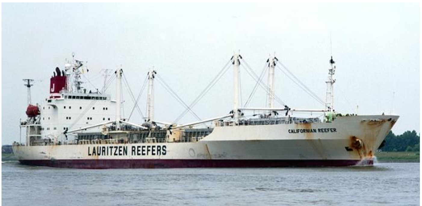
HUMBOLDT BAY, IMO 8907888 (NB-150), 20-10-1989 te water gelaten, 1-1990 opgeleverd door Kanasashi Co., Toyohashi (3215) als HUMBOLDT REX aan TS Reefer S.A., Panama. 1994 herdoopt CALIFORNIAN REEFER. 1998 verkocht aan Woolstone Shipping Co. Ltd., Cyprus, in beheer bij Amer Shipping Ltd., herdoopt AMER WHITNEY. 2003 verkocht aan Chacewater Shipping Ltd., Cyprus, in beheer bij Amer Shipping Ltd. 13-6-2007 in beheer bij FML Ship Management Ltd., Nicosia. 26-10-2007 verkocht aan Roseworthy Reefers Co. Ltd., Liberia, in beheer bij FML Ship Management Ltd., Nicosia. 19-11-2008 verkocht aan Humboldt Bay Shipping Co. B.V., Monrovia-Liberia, in beheer bij Seatrade Groningen B.V., 24-11-2008 overgedragen en herdoopt HUMBOLDT BAY. 5-2019 verkocht aan Humboldt Bay Shipping Co. N.V., Monrovia-Liberia, in beheer bij Seatrade Groningen B.V., Groningen. 15-12-2019 opgelegd. 16-10-2020 verkocht aan Fuwantong Ocean Shipping Co., Hong Kong, vlag: Panama (HO4706), herdoopt ZHONG FU HAO 111. 12-1-2021 van Taizhou, China naar de ankerplaats.