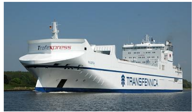
PUPLCA foto: Ruud Zegwaard