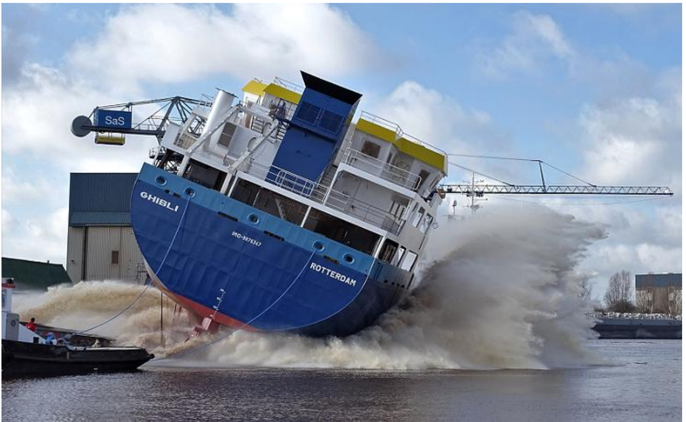
GHIBLI, IMO 9876347 (NB-277), LPG Tanker, 17-7-2019 kiel gelegd onder bouwnummer SHIP 842, 26-2-2021 te water gelaten te Foxhol onder bouwnummer 842, assistentie van de sleepboten INVICTUS en FERRY-JO, 6-2021 geplande oplevering door Ship and Steelbuilding B.V., Foxhol aan Chemgas Shipping B.V., Rotterdam (Chemgas Holding B.V.), 2.999 GT, 2.450 DWT.