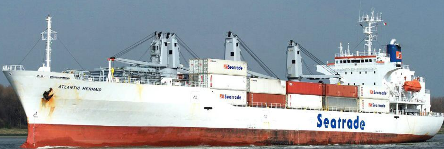
Mutaties Nederlandse Zeeschepen, NIEUWSBRIEF 270

ATLANTIC MERMAID, IMO 9045936 (NB-243), 18-2-1992 te water, 4-1992 opgeleverd door Iwagi Zosen KK, Iwagi (146) als ATLANTIC MERMAID aan Southern Route Maritime S.A., Panama, in beheer bij Nissn Kaiun K.K. 9.829 GT, 10.464 DWT. 12.460 EPK, 14.725 m 3 . 9.165 kW, B&W, Hitachi Zosen, snelheid 19.5 kn. 2000 verkocht aan Sealink Champion S.A., Panama, in beheer bij Elmira Shipping & Trading S.A. 2004 verkocht aan Callier Shipping Inc., Panama, in beheer bij Elmira Shipping & Trading S.A. 21-6-2004 in beheer Seatrade Groningen B.V. 2006 verkocht aan First Atlantic Mermaid Maritime Inc, 20-6-2006 thuishaven en vlag: Monrovia-Liberia, roepsein A8JJ3, in beheer bij Triton Schiffahrts G.m.b.H. Co. K.G., Leer, Duitsland, in de pool bij Seatrade Groningen B.V. 2007 verkocht aan Atlantic Mermaid Schiffahrts G.m.b.H. & Co. K.G., Monrovia-Liberia, in beheer bij Triton Schiffahrts G.m.b.H. Co. K.G., Leer, Duitsland, in de pool bij Seatrade Groningen B.V. 7-2017 verkocht aan TCT Marine Surveyor & Claim Co. Ltd., Panama, roepsein H3UQ, in beheer bij Oceangrowing Shipping Limited, Hong Kong, 19-7-2017 gearriveerd te Las Palmas, 26-7-2017 (mt) herdoopt ATLANTIC GEM. 5-2020 herdoopt SHUN ZE LENG 7. (Foto: L. Bot, 11-4-2008, afvarend t.h.v. Rozenburg).