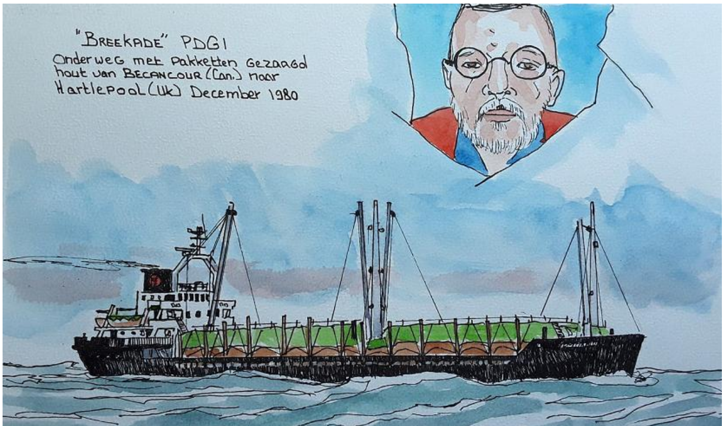
Tekening: Folkert Pietersen

2.800 EPK, 2.089 kW, V 16 cyl, 4 tew, 250 x 300, 750 omw/min., vertraagd naar 254 omw/min., Polar SF116VS-F, Nydqvist & Holm, Trollhättan.