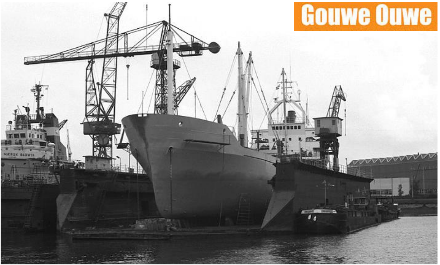
BREEKADE, 4-7-1978 in dok bij Niehuis & v.d. Berg in de Eemhaven te Pernis

m.s. BREEKADE 7325643 1978-1985 vrachtschip PDGI