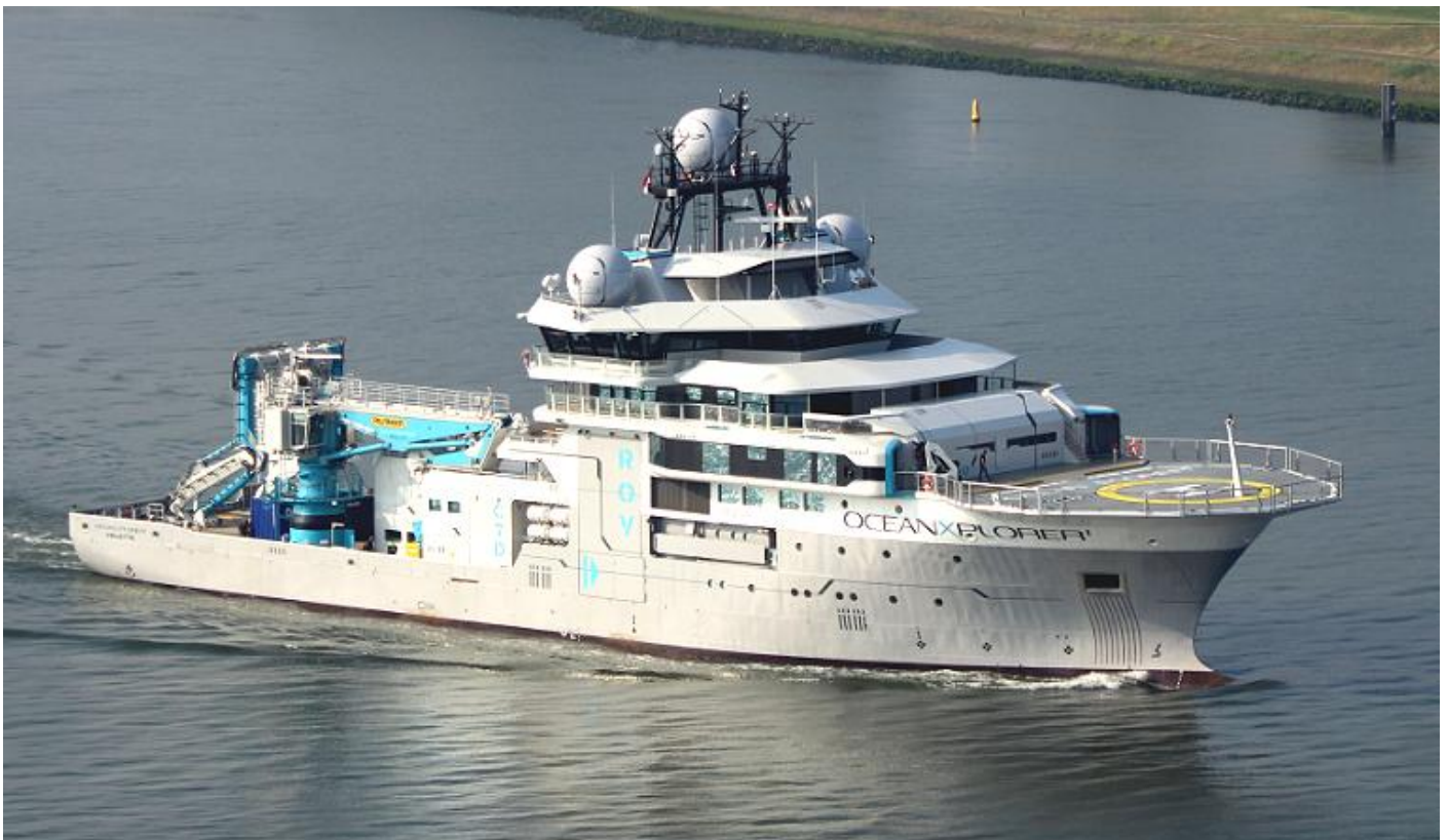
Damen verbouwt schip voor wetenschappers

PIONEERING SPIRIT, IMO 9593505. 10-6-2020 van de Maasvlakte naar zee, 6-2020 het 44 jaar oude 3e platform van Brent Alpha Field (Shell) verwijderd, 24-6-2020 het platform op de ponton IRON LADY (IMO 9665140, ex Shanghai Zhenhua ZPMC 1043) afgeleverd door 3 VB sleepboten bij Able te Teesside om gesloopt te worden. 27-6-2020 PIONEERING SPIRIT te Kristiansand.