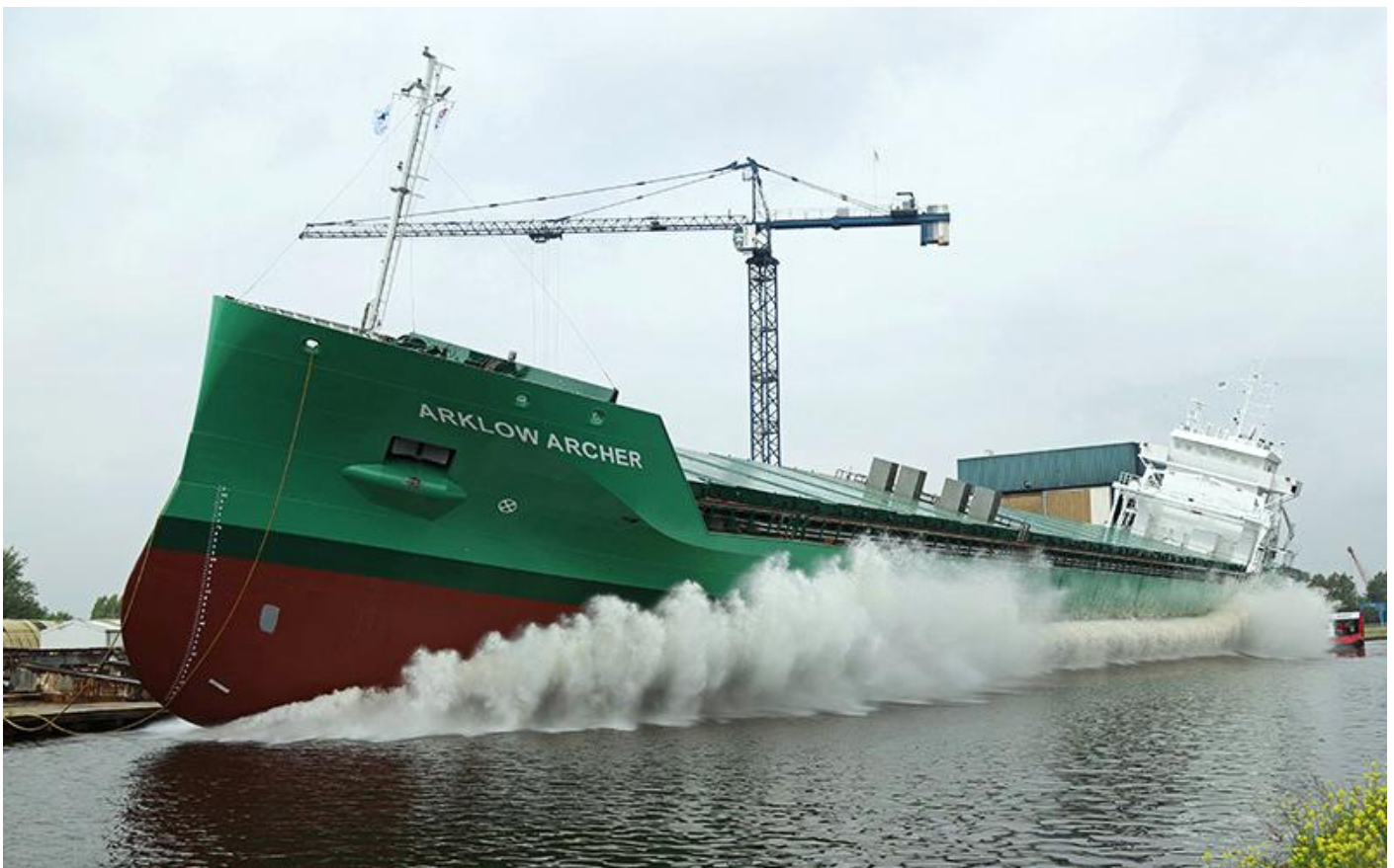
m.s. ARKLOW ARCHER te water gelaten

ARKLOW WOOD, IMO 9818967 (NB-167), 14-12-2015 (e) kiel gelegd als FERUS SMIT 450, 3-4-2020 te water gelaten bij Ferus Smit G.m.b.H., Leer, assistentie van de WATERSTAD en GRUNO IV, in aanbouw voor Glenart Shipping Ltd., Arklow, in beheer bij Arklow Shipping ULC, 4-2020 geplande oplevering, 8-6-2020 vanaf de werf gearriveerd op de Eemshaven, 9-6-2020 proefvaart op de Eems, 12-6-2020 (e) opgeleverd aan Arklow Shipping ULC, Arklow-Ierland (EIWT5). 9.999 GT, 16.861 DWT. 149,50 x 19,25 meter, 3.840 kW. 16-6-2020 van de Eemshaven naar Arkhangelsk, Rusland, 23-6-2020 ETA te Arkhangelsk.