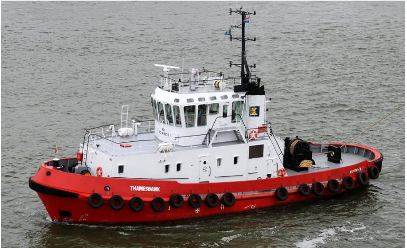
THAMESBANK in de kleuren van Kotug Smit Towage Rotterdam B.V. Foto: Teun v.d. Zee, 8-9-2018.

THAMESBANK, IMO 9060704, 27-4-1992 te water gelaten, 1-10-1992 (BV) opgeleverd door Alstom Leroux Naval, St. Malo (Navale Saint Malo) (616) aan Smit Internationale Havensleepdiensten B.V., Rotterdam. Roepsein PHYE. 321 GT, 96 NT, 196 DWT. 30,60 (28,00) x 9,95 x 4,02 x 5,50 meter. 76 m3 bunkers. 11,5 kn. 3.356 EPK, 2470 kW, 2 x 6 cyl - 240 x 280, 1.000 rpm., 2 Azimuth Thrusters, Deutz SBV6M628, Klöckner-Humboldt-Deutz A.G., Keulen. 2-4-2002 verkocht aan SMIT Harbour Towage Rotterdam B.V. 2016 in beheer bij Kotug Smit Towage Rotterdam B.V. 1-8-2019 in beheer bij Boluda Corporación Maritima S.L. 23-9-2019 in beheer bij Boluda Towage Rotterdam B.V. (Foto: T. van der Zee, 16-7-2005).