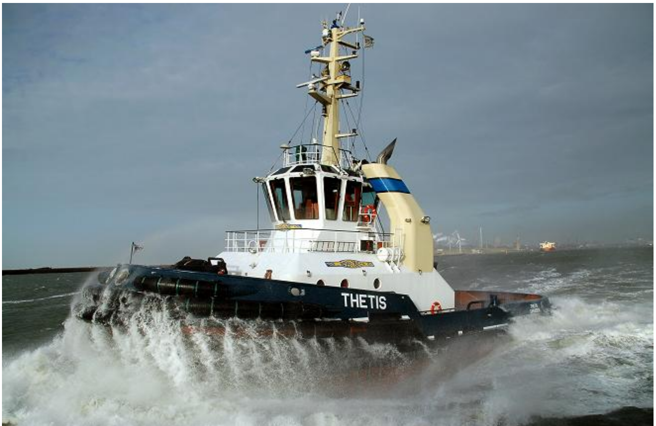
THETIS (3), IMO 9252527 (NB-99), Delta Azimuth Tug 2800, casco gebouwd door Apetin Yard, 8-3-2003 te water, afgebouwd bij I.H.C. Delta Shipyard (989), 21-6-2003 van Sliedrecht naar Schiedam voor het maken