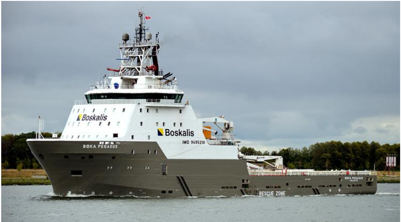
BOKA PEGASUS

herdoopt BOKA PEGASUS. 12-7-2019 thuishaven en vlag: Valletta-Malta, roepsein 9HA5057. 15-7-2019 vertrokken van Rotterdam naar Aberdeen.