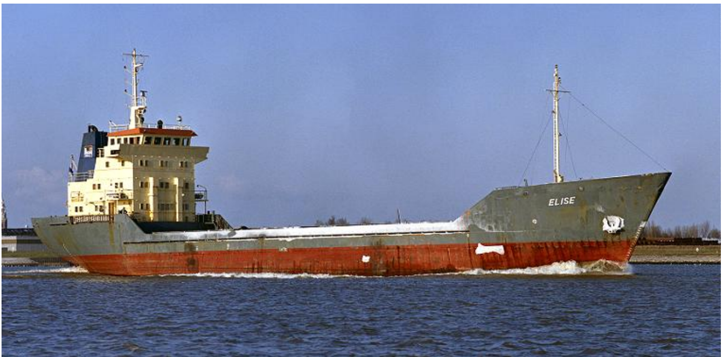
m.s. ELISE, ex SYLVIA BETA, 11-1-1987