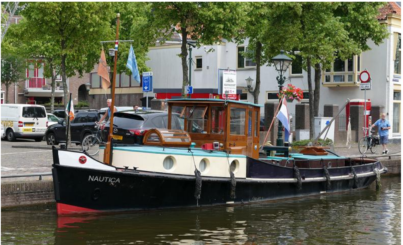
NAUTICA, 20-6-2017, Alkmaar