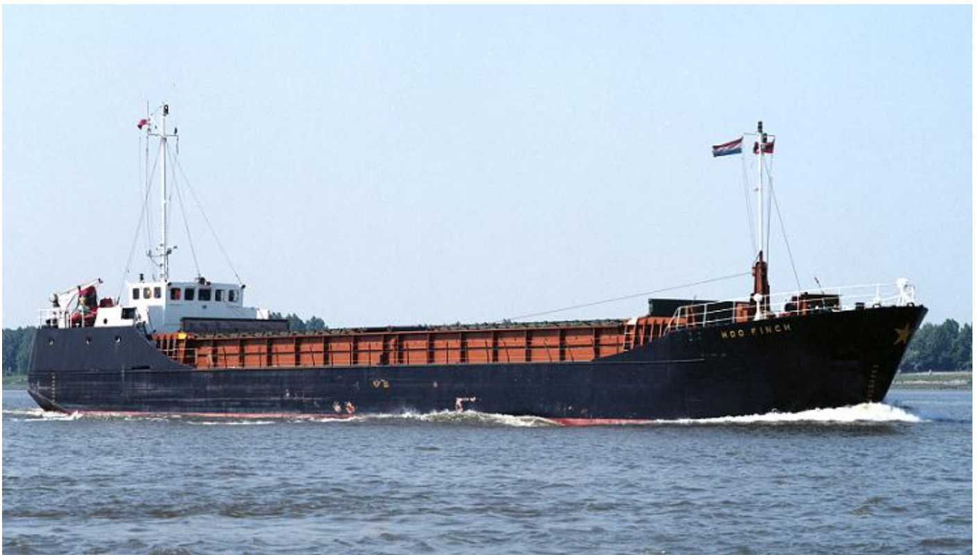
ZAIN, IMO 8804775, ex HOO FINCH. GC. 1988. 1-2019 gesloopt.