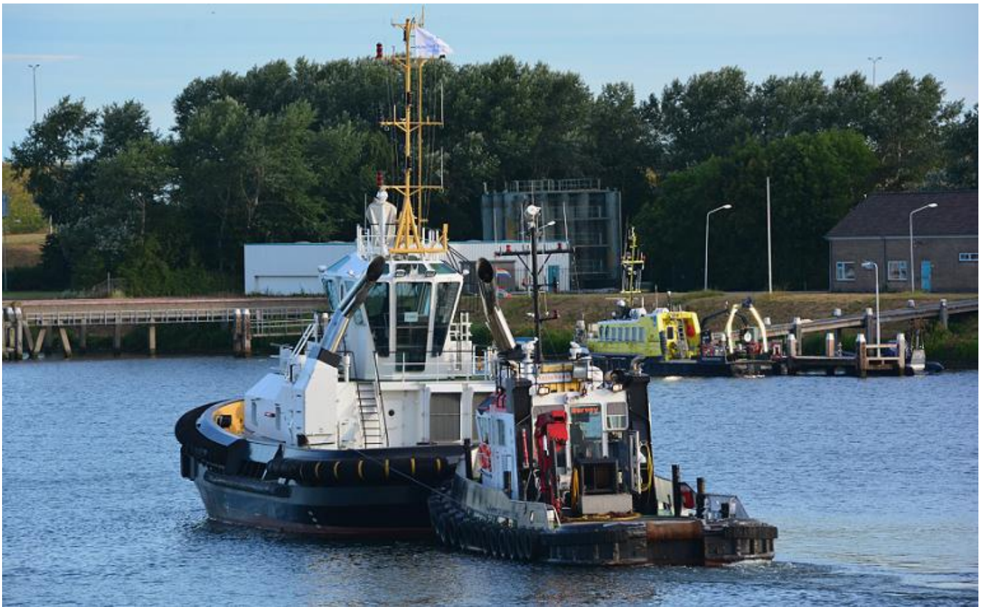
YN 512285 met DANCING WATER, 22-7-2019 vertrek van Stellendam naar Den Helder