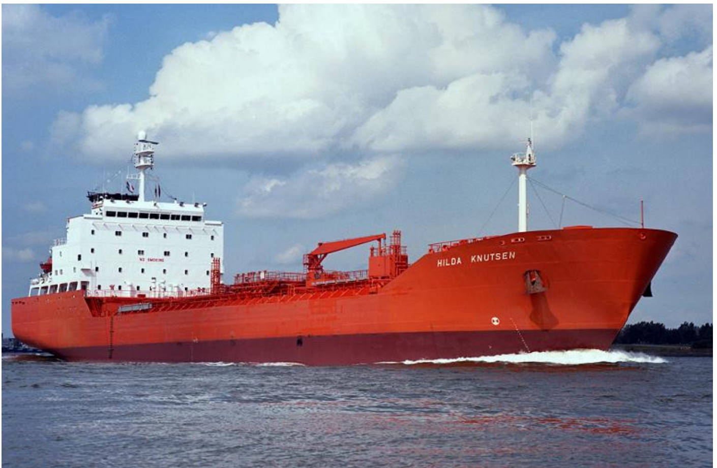
HILDA KNUTSEN, foto: Teun v.d. Zee, 5-9-1990