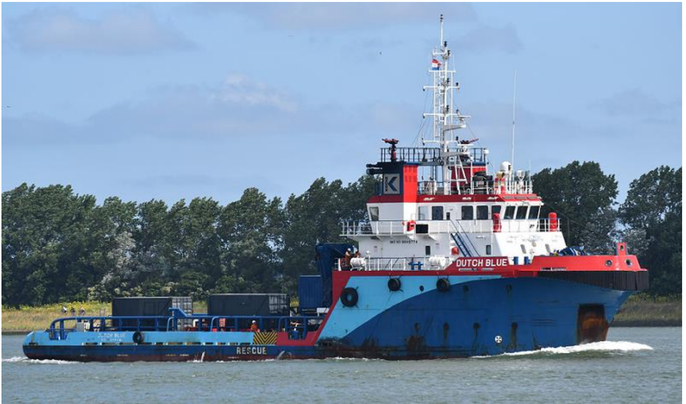
28-6-2024 gearriveerd bij Damen Verolme in de Botlek (nog) onder de naam DUTCH BLUE.

LEON-H, IMO 1013212 (NB-316), Utility Vessel, Hybrid Cat 2411E, 186 GT, 17-2-2023 besteld bij Werft Shipbuilding onder bouwnummer VCU 003, in de nacht van 20 op 21 februari van de bouwlocatie op het industrieterrein verplaatst naar de haven, 21-2-2024 te water gezet, 30-4-2024 geplande oplevering, 18-6-2024 opgeleverd aan TB Waterwerken B.V., Urk (PHBP). 24,00 x 11,50 x . x . 1,500 meter. 2 x 930 kW, Scania generators, 3 x 450 kW E-motor. Trekkracht 15 ton.