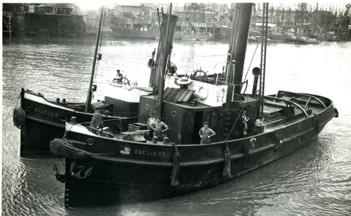
ABEILLE 9 Remorqueur 1936

naar een moderne en gedurfde vloot sleepboten. Begin jaren negentig had Les Abeilles vrijwel het monopolie op de havensleepvaart in Frankrijk.