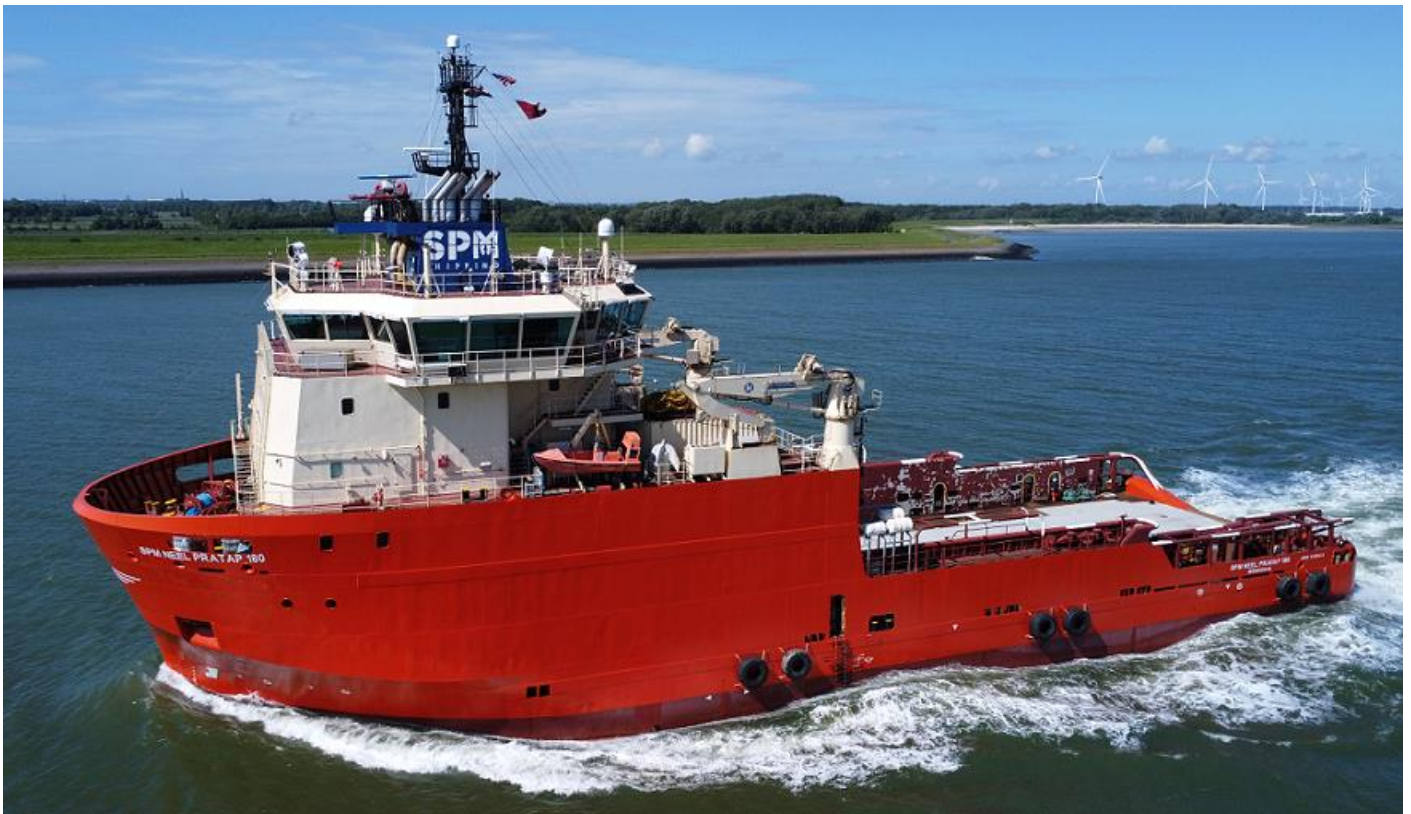
SPM NEEL PRATAP 180, IMO 9388613, ex MAERSK TRACER. 17-5-2024 in beheer bij Total Marine India Pvt. Ltd., Navi Mumbai, India. Het Offshore Tug/Supply Ship is niet in Antwerpen geweest op 29 mei, is vanuit Sluiskil naar de Everingen gegaan voor bunkers. Daarna naar de

LEON-H, IMO 1013212 (NB-316), Utility Vessel, Hybrid Cat 2411E, 186 GT, 17-2-2023 besteld bij Werft Shipbuilding onder bouwnummer VCU 003, in de nacht van 20 op 21 februari van de bouwlocatie op het industrieterrein verplaatst naar de haven, 21-2-2024 te water gezet, 30-4-2024 geplande oplevering, 18-6-2024 opgeleverd aan TB Waterwerken B.V., Urk (PHBP). 24,00 x 11,50 x . x . 1,500 meter. 2 x 930 kW, Scania generators, 3 x 450 kW E-motor. Trekkracht 15 ton.